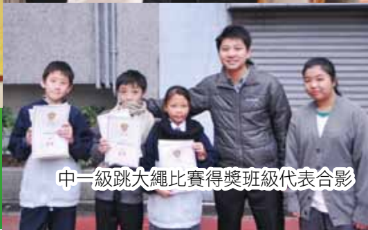
中一級跳大繩比賽得獎班級代表合影