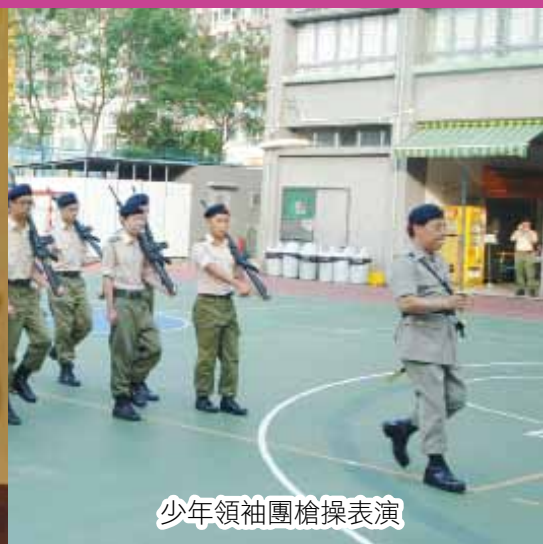
少年領袖團槍操表演