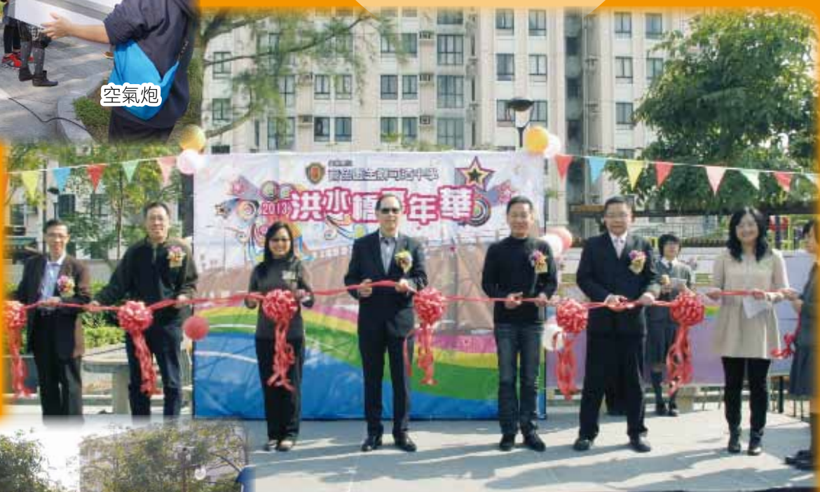
嘉賓主持剪綵儀式