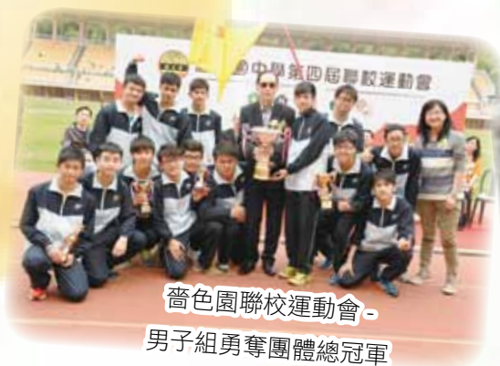
舊色園聯校運動會 - 男子組勇奪團體總冠軍