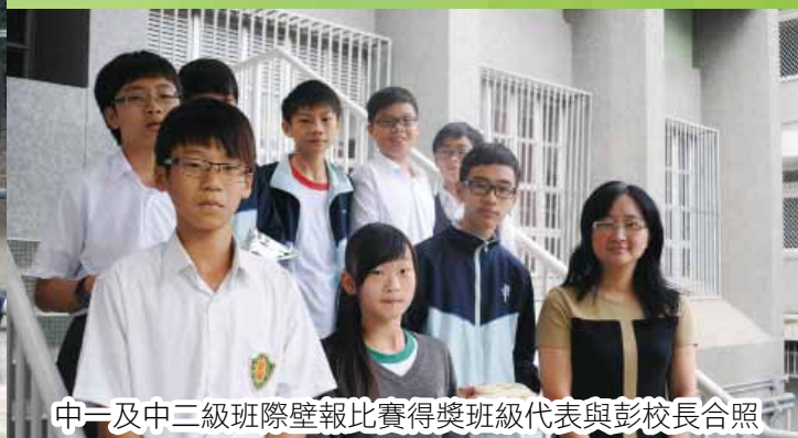
中一及中三級班際壁報比賽得獎班級代表與彭校長合照