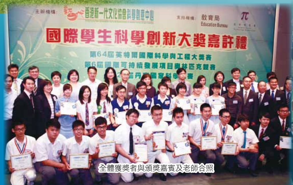
全體獲獎者與頒獎嘉賓及老師合照