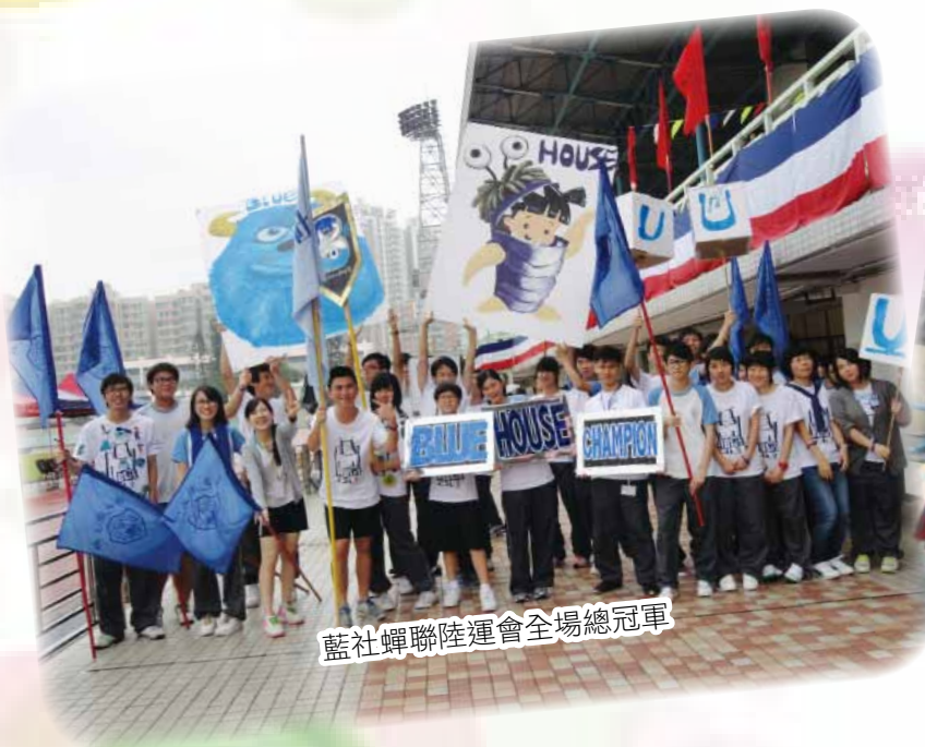
藍社蟬聯陸運會全場總冠軍