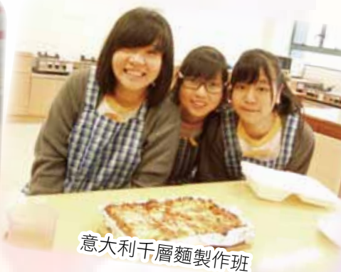
意大利千層麵製作班