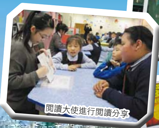
閱讀大使進行閱讀分享