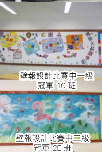
壁報設計比賽中一級冠軍 1C 班