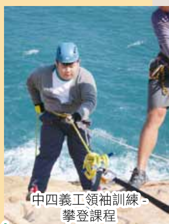
中四義工領袖訓練 - 攀登課程