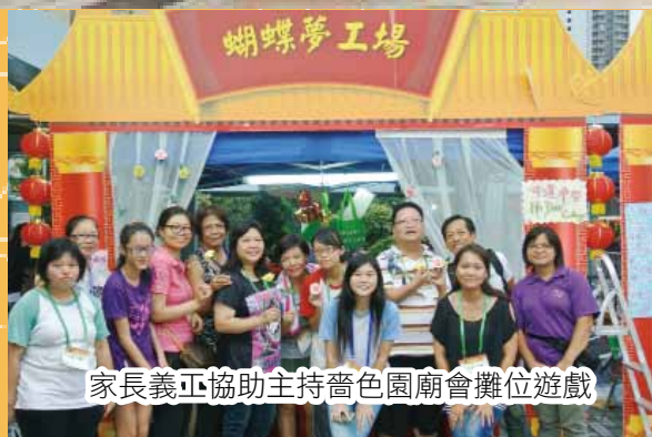
家長義工協助主持舊色園廟會攤位遊戲