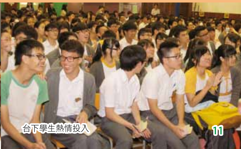
台下學生熱情投入