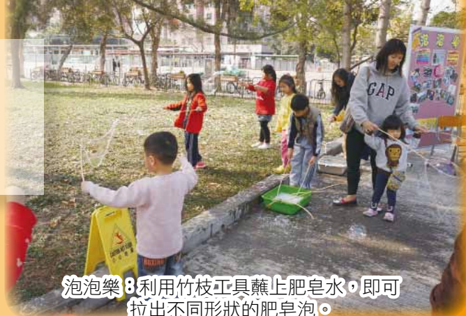
泡泡樂：利用竹枝工具蘸上肥皂水，即可拉出不同形狀的肥皂泡。

本校於1月19日(六)假洪水橋靜態公園舉行嘉年華，以遊藝嘉年華的形式向區內坊眾提供娛樂活動，促進建立和諧及富特色的洪水橋社區。當天除了有不同的表演外，還設有數理、視藝的攤位，提供有趣的玩意予坊眾耍樂，務求寓學習於娛樂。臨近新歲，製作新春擺設、書寫揮春的攤位更大受歡迎。