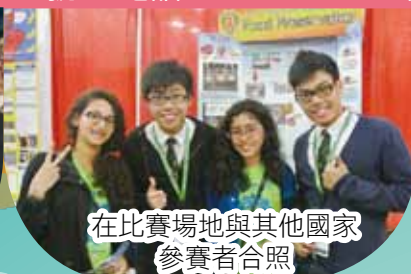
在比賽場地與其他國家 參賽者合照