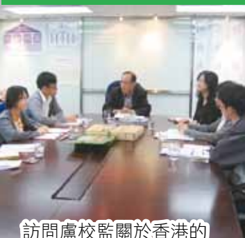
訪問盧校監關於香港的 環保建築