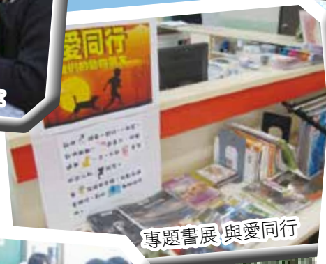
專題書展 與愛同行