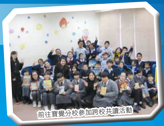
前往寶覺分校參加跨校共讀活動

本校組織了一隊「閱讀大使」，負責推廣閱讀，培養校園的閱讀風氣；同時亦積極透過不同的媒介，讓學生接觸不同學科、領域的知識，藉以擴闊學生的視野。活動包括晨讀、主題閱讀、攤位遊戲、午膳班訪、「悅讀·閱讀」展板、早會好書推介、中一級中文閱讀匯報比賽、世界閱讀日的認識等；今學年再次進行「跨科主題閱讀」，讓各科可以透過相同的閱讀主題，把學生引領更深更廣的閱讀世界，以建立「閱讀齊參與」的校園文化。另外，本校亦與區內的小學合作，推行「跨校共讀活動」，希望透過不同形式的交流活動，藉以推廣閱讀風氣。