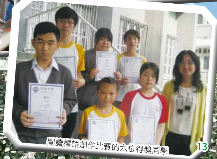
閱讀標語創作比賽的六位得獎同學