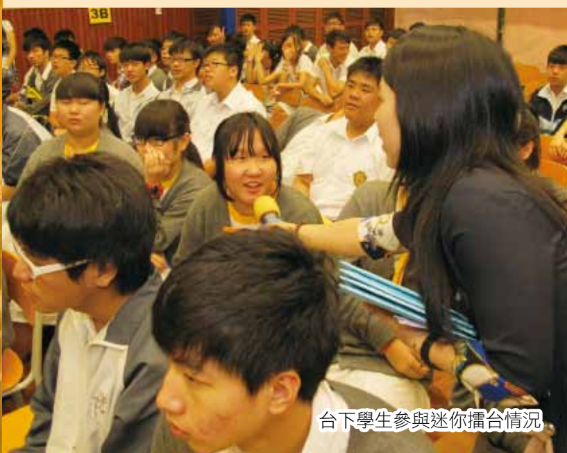
台下學生參與迷你擂台情況

「社際學術時事常識問答比賽」於5月15日(星期三)第五及第六節舉行，最終綠社取得730分，以10分之差力壓紅社勇奪冠軍，而紅社(720分)及藍社(660分)分別奪得亞軍及季軍。比賽由教學支援組、資訊科技發展組及課外活動組合辦，參賽級別為中三至中五級，共分六個回合進行，並設「迷你擂台」環節，藉此增加台下觀賽學生的互動性。賽事除以簡報投映題目之外，亦設有電子計分牌、時間倒數提示及參賽者近鏡追蹤，場面氣氛熱烈，台上及台下的社員均全神貫注，投入賽事。