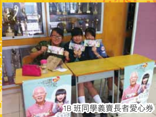
1B 班同學義賣長者愛心券

高中方面，老師致力培育義工領袖，在校內及校外讓同學多發揮領袖的角色。本年度，部分中四級參與義工領袖培訓計劃，透過生命導向課程及攀登課程，認識自我，挑戰自己，提升自信，反思生命。