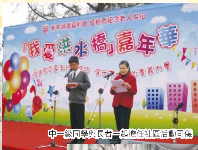
中一級同學與長者一起擔任社區活動司儀