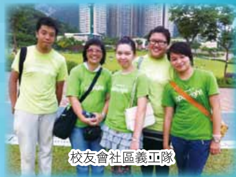
校友會社區義工隊