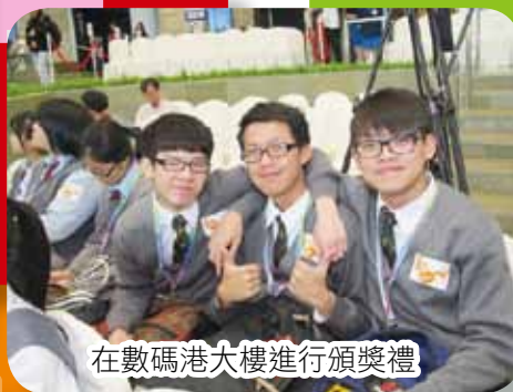
在數碼港大樓進行頒獎禮