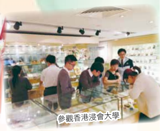
參觀香港浸會大學