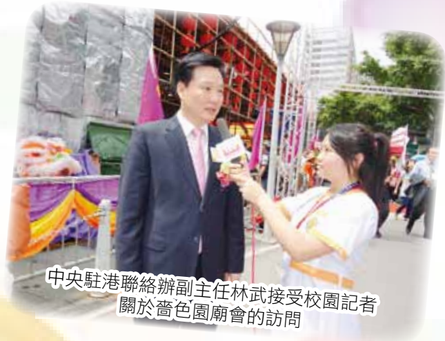
中央駐港聯絡辦副主任林武接受校園記者 關於薈色園廟會的訪問