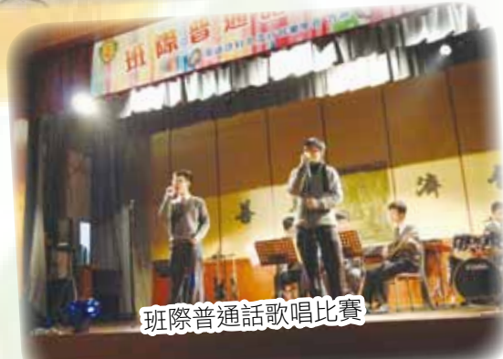
班際普通話歌唱比賽