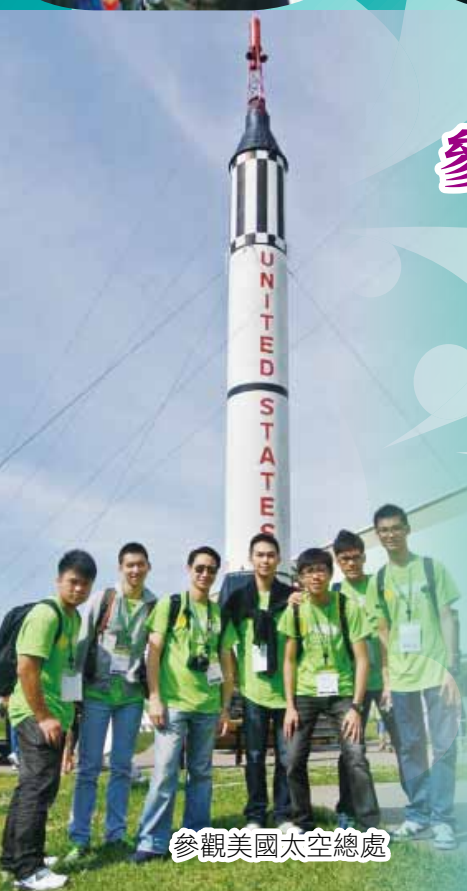
參觀美國太空總處