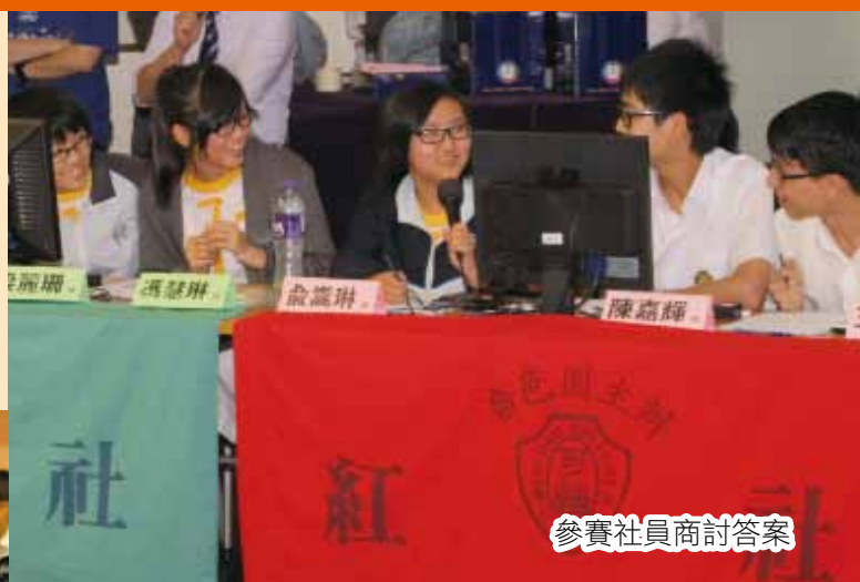
參賽社員商討答案