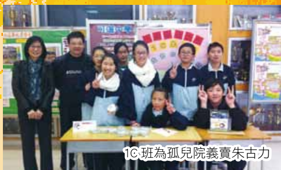
1C 班為孤兒院義賣朱古力