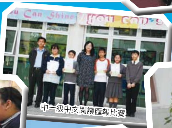
中一級中文閱讀匯報比賽