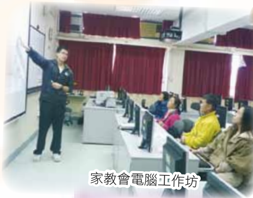
家教會電腦工作坊