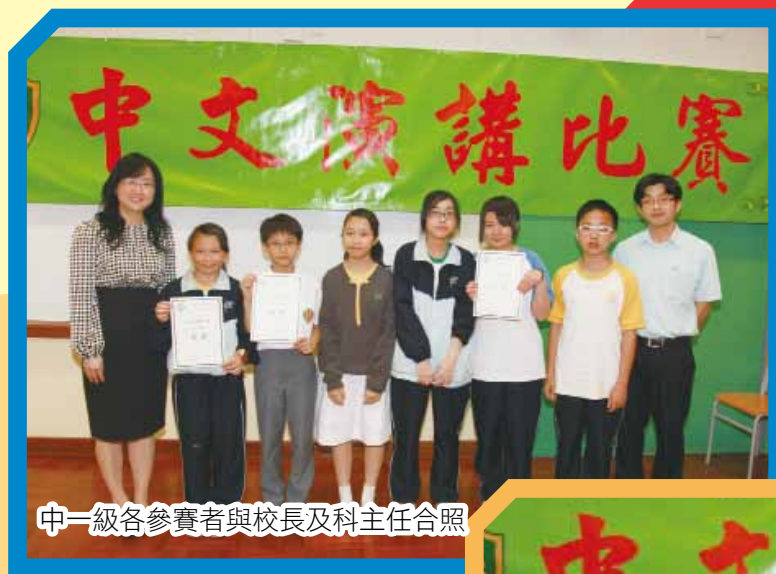
中一級各參賽者與校長及科主任合照