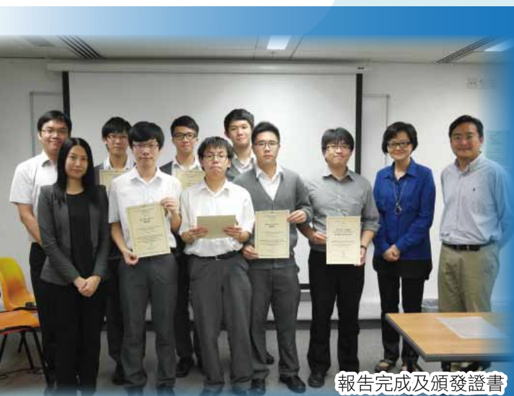
報告完成及頒發證書

為進一步培育學生的數學能力，數學科與教育局資優教育組合作，用課堂以外的時間為學生進行校本抽離式的數學增益課程，透過額外的學習機會，包括應用統計學、分析人造衛星遙感影像，以及應用地理訊息系統 (GIS) 相關軟件處理來自不同機構所得的公開數據，整理一份研究報告，藉以培養學生的探究及自學能力。