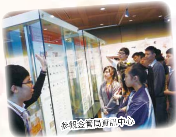
參觀金管局資訊中心