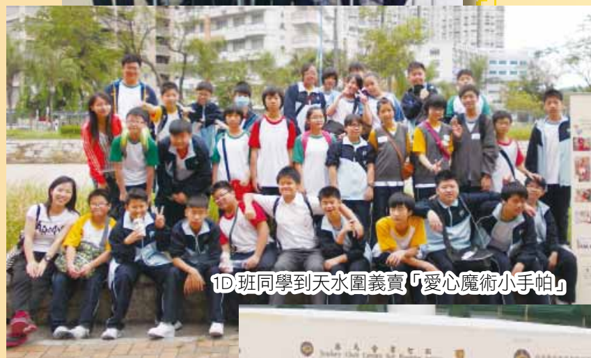
1D 班同學到天水圍義賣「愛心魔術小手帕」