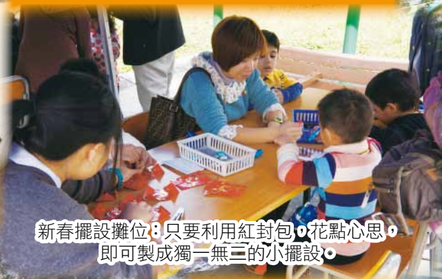
新春擺設攤位：只要利用紅封包，花點心思，即可製成獨一無三的小擺設。