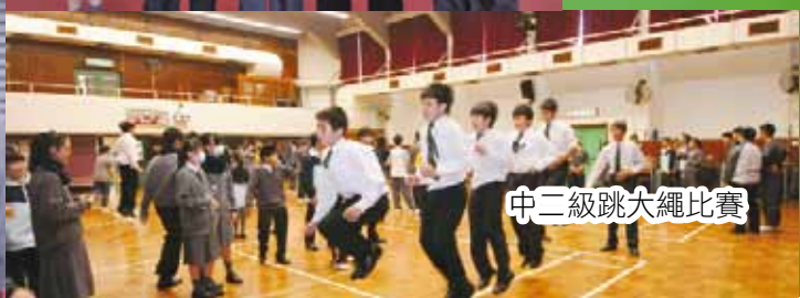
中二級跳大繩比賽