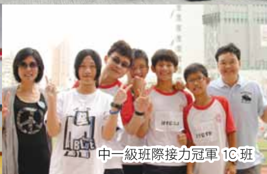
中一級班際接力冠軍 1C 班