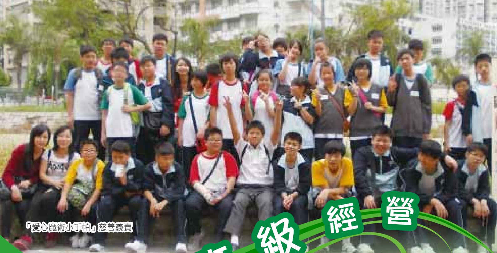
「愛心魔術小手帕」慈善義賣