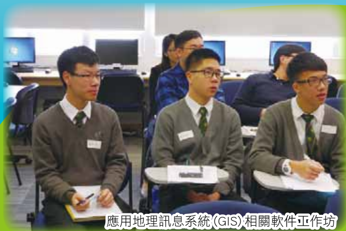
應用地理訊息系統 (GIS) 相關軟件工作坊