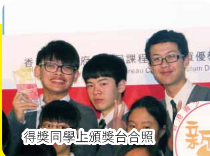
得獎同學上頒獎台合照