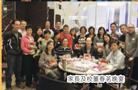
家長及校董春茗晚宴