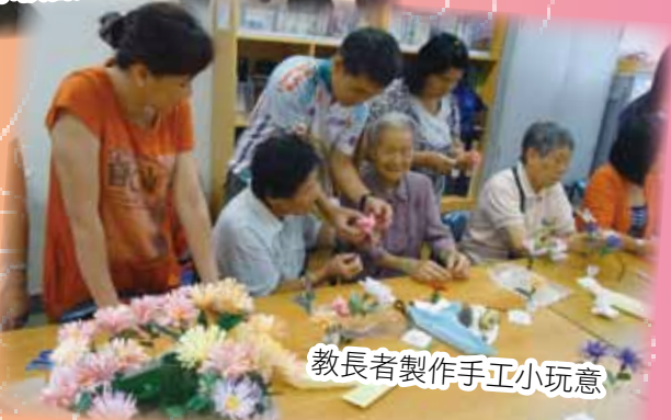
教長者製作手工小玩意