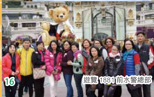
遊覽 1881 前水警總部

本校家長教師會已成立十五載，家校合作無間，家長們均關心學校發展，積極參與活動。而家長教師會舉辦多元化活動，促進家校合作與溝通，貫徹「家校同心育良才」的目標。