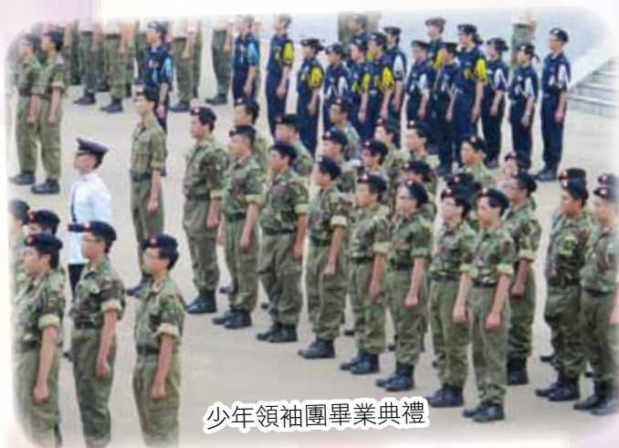
少年領袖團畢業典禮