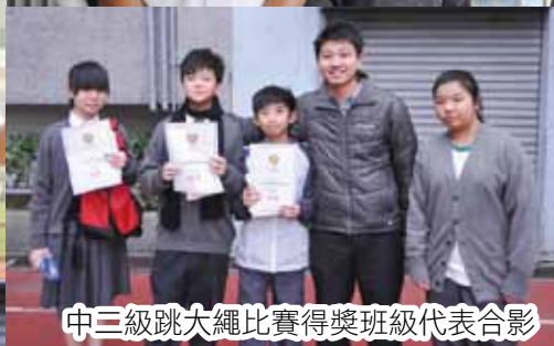
中三級跳大繩比賽得獎班級代表合影