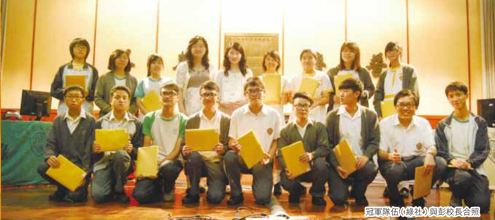
冠軍隊伍(綠社)與彭校長合照