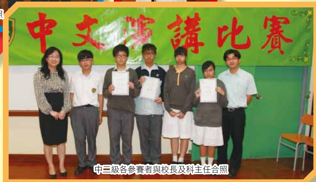
中二級各參賽者與校長及科主任合照