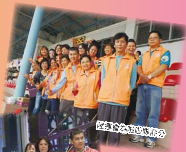
陸運會為啦啦隊評分

本校家長教師會已成立十五載，家校合作無間，家長們均關心學校發展，積極參與活動。而家長教師會舉辦多元化活動，促進家校合作與溝通，貫徹「家校同心育良才」的目標。