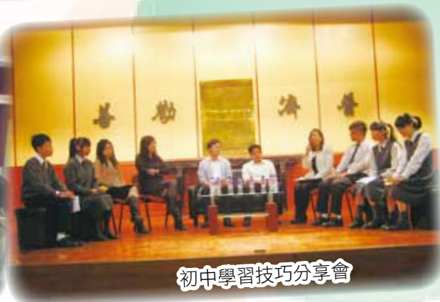
初中學習技巧分享會