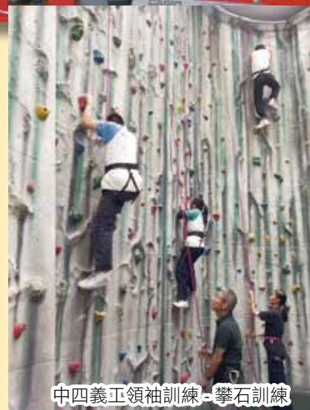
中四義工領袖訓練 - 攀石訓練