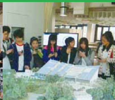
參觀九龍灣零碳天地