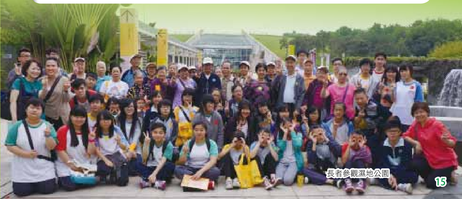
長者參觀濕地公園

本校又利用早講、周會、晨讀時段、展板製作來宣揚環保訊息，並提供最新的環保資訊；同時透過學生環保大使計劃、廢物分類回收計劃、戶外考察等活動，讓學生能通過反思，重新審視自身的生活態度，奉行節約，珍惜資源，藉此建立低碳校園。環境教育組在校園內的【綠頂上的能源教室】及【再生能源長者教育中心】定期舉行環境教育工作坊，邀請大學教授或專業人士主持，供區內及區外的中小學師生、長者、家長等參與，肩負向坊眾宣揚節能減排的訊息，把本校打造為綠色教育平台，倡導綠色生活。