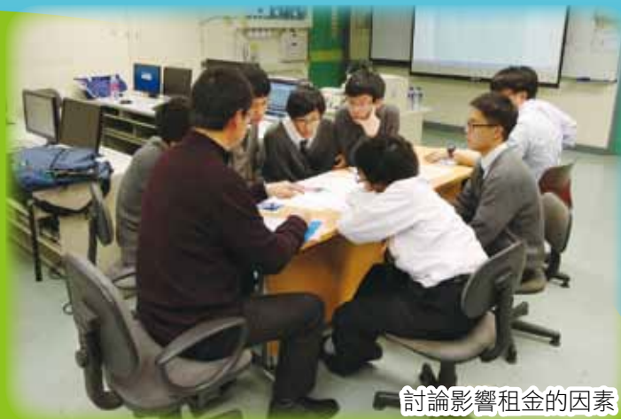
討論影響租金的因素