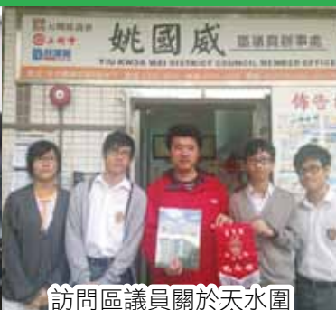
訪問區議員關於天水圍 節能減排情況