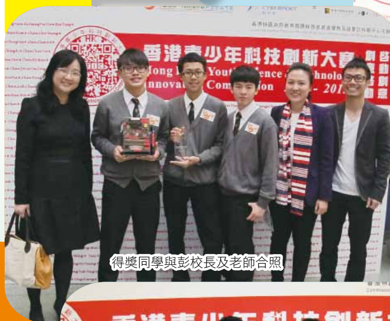
得獎同學與彭校長及老師合照