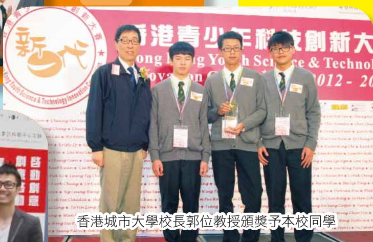
香港城市大學校長郭位教授頒獎予本校同學