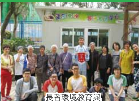
長者環境教育與 護生課大合照