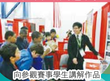
向參觀賽事學生講解作品