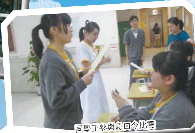
同學正參與急回令比賽