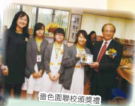
舊色園聯校頒獎禮