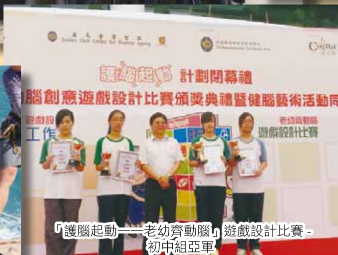
「護腦起動——老幼齊動腦」遊戲設計比賽 - 初中組亞軍