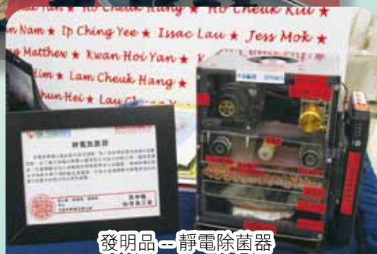
發明品——靜電除菌器