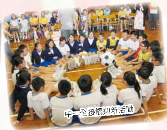
中一全接觸迎新活動