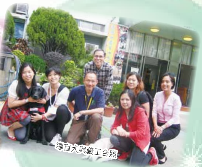
導盲犬與義工合照