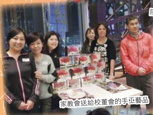
家教會送給校董會的手工藝品