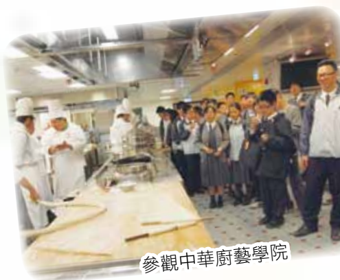
參觀中華廚藝學院