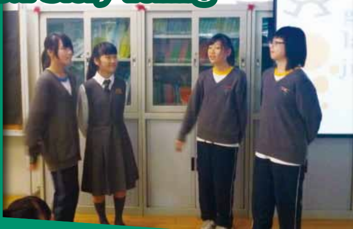
S.1 Story Telling