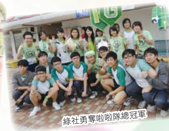
綠社勇奪啦啦隊總冠軍