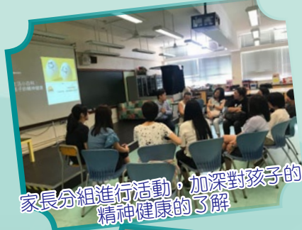
家長分組進行活動，加深對孩子的精神健康的了解