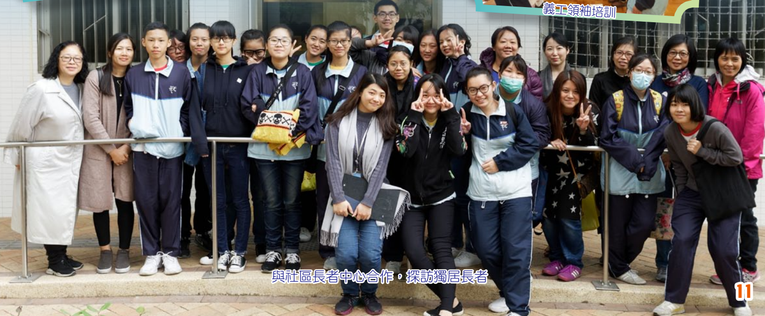
與社區長者中心合作，探訪獨居長者