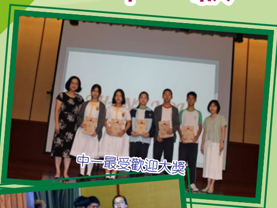
中一最受歡迎大獎