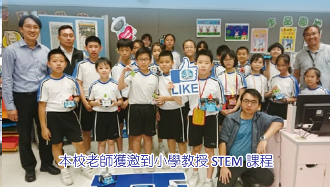
本校老師獲邀到小學教授 STEM 課程