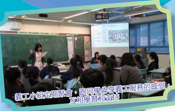
義工小組定期聚會，跟同學分享義工服務的感受，互相學習和支持