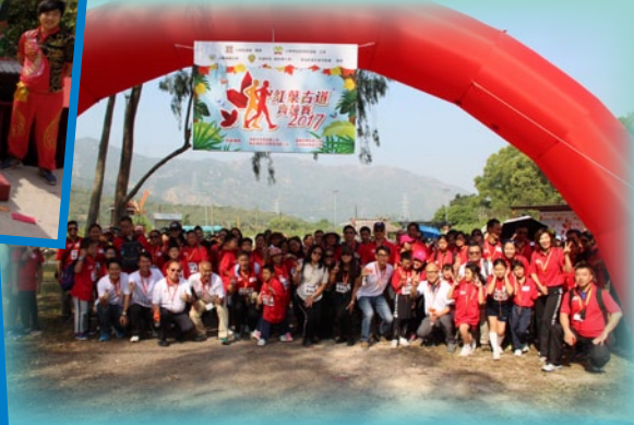
參加者與大會工作人員在起步禮前大合照。