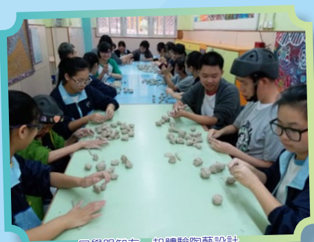
同學跟智友一起體驗陶藝設計