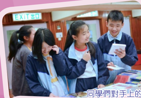
同學們對手上的書籍愛不釋手！