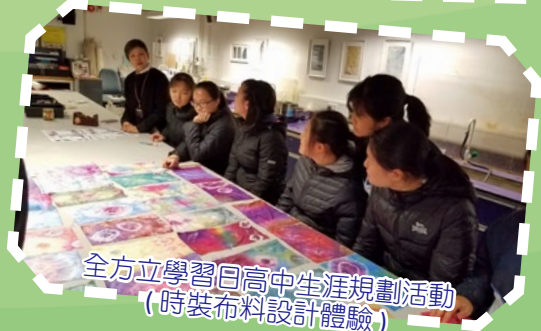
全方位學習日高中生涯規劃活動 (時裝布料設計體驗)