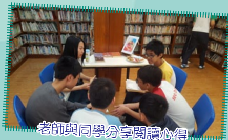
老師與同學分享閱讀心得