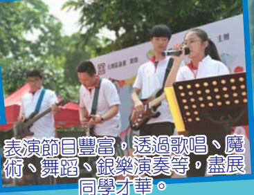
表演節目豐富，透過歌唱、魔術、舞蹈、銀樂演奏等，盡展同學才華。