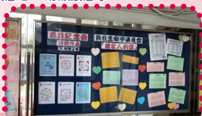
關愛分享 - 鼓勵同學主動關心同學，理解及照顧別人的感受。

在心靈發展方面，我們相信感恩是快樂的來源！本年度舉辦了感恩滿校園活動，當中包括一分鐘感恩、我在生命遇見你 - 給家人的信、生命留言冊、感恩紀念冊等，培養學生常存感恩之心，感受他人善意與關懷，並能加以回報。