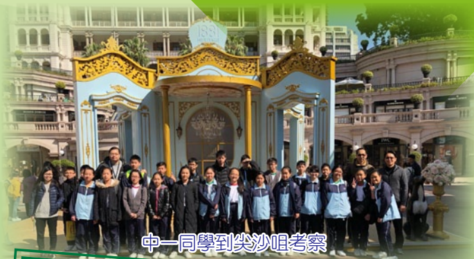
中一同學到尖沙咀考察