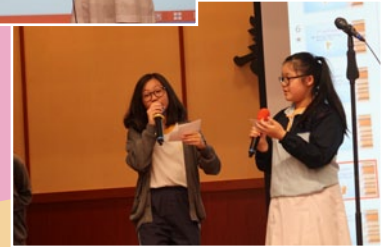
The emcees are introducing the contestants of S4-S5 Persuasive Speech Competition.