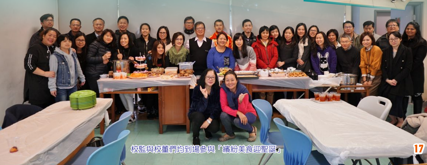
校監與校董們均到場參與「繽紛美食迎聖誕」