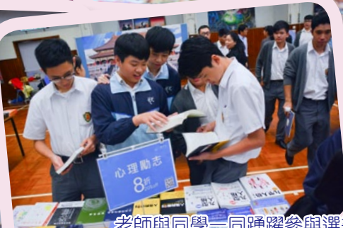
老師與同學一同踴躍參與選書行列！