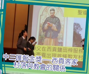
中三匯報金獎——西貢客家村落與教會的關係