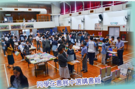
同學在書展中選購書籍