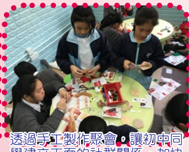
透過手工製作聚會，讓初中同學建立正面的社群關係，加快適應學校生活，並培養同學對學校的歸屬感。