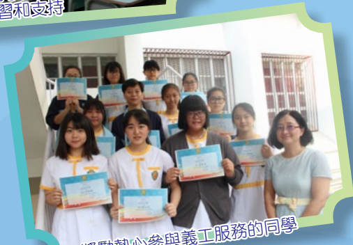
獎勵熱心參與義工服務的同學