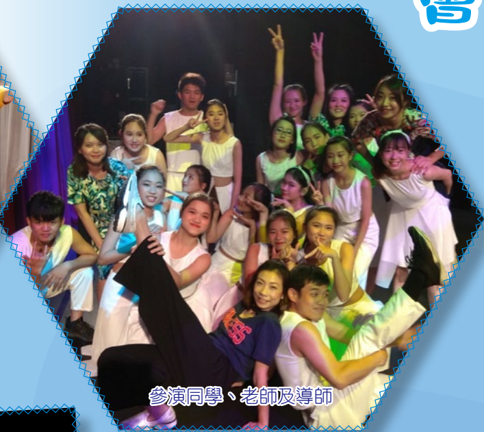
參演同學、老師及導師