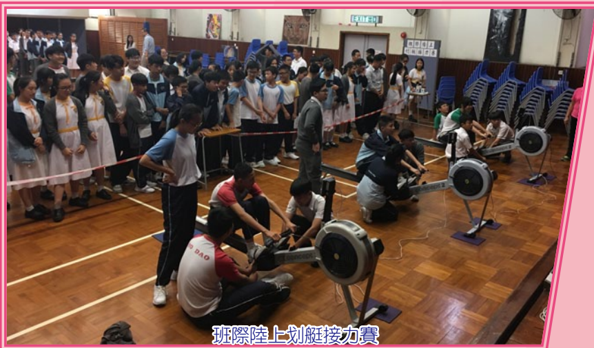
班際陸上划艇接力賽

透過與體育組、聯課活動組、學生會、生涯規劃組、英文科、通識科及理科協調各類型班際比賽，營造一個積極正面的校園氛圍。透過活動，發揮學生的所長，展現潛能，亦可使學生對所屬班別及學校產生濃厚的歸屬感。