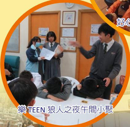
樂TEEN 狼人之夜午間小聚