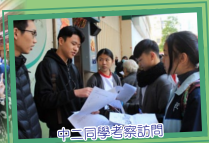
中二同學考察訪問