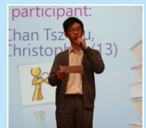
Our S4-S5 students are giving speeches with confidence.