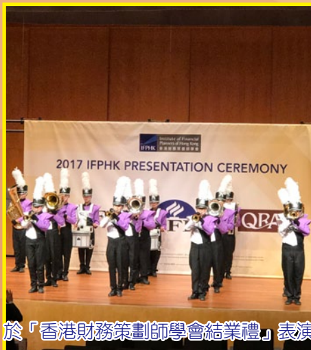
於「香港財務策劃師學會結業禮」表演

本校透過音樂藝術陶冶學生性情，令他們建立良好品格、有健康的身心發展及團隊精神。本校推行「中樂培訓計劃」學生至今已經踏入第四年，開辦七個主要的樂器班，分別是笛子、二胡、琵琶、柳琴、中阮、古箏和揚琴，以小組形式，由個別專項導師獨立教授。步操樂團更於「2018 上海旅遊節」、「香港財務策劃師學會結業禮」及「中六視藝作品展」中表演。每年的上海旅遊節以規模宏大的開幕式大巡遊拉開帷幕，並邀請來自世界各地的代表團體參加，本校步操樂團獲邀參與此盛事及公益活動，深感榮幸。透過與來自世界各地的表演團隊進行觀摩及交流，讓學生增廣見聞、增強自信心及培養團隊精神。