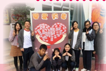
大家一起簽署關愛約章