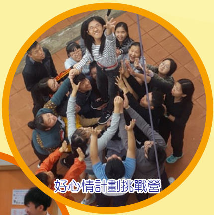
好心情計劃挑戰營

本校著重學生的品格、價值觀及身心靈的發展。輔導組主要由四大活動及組織形成：好心情計劃、樂TEEN大使、Best Buddy Hong Kong 及魔術雜耍隊，透過持續性及多樣化的訓練及服務，讓同學在學業、群性、感情方面得到充分的發展，為成為負責任的成年人作好準備。近年成立的魔術雜耍隊，樂於參加校外比賽及校內演出，同學的表達能力、社交合作能力及自信心均得以提升，成效理想。透過全年的活動，輔導組培育學生自律守紀、互相尊重，幫助學生建立自信，並實踐健康的生活方式。