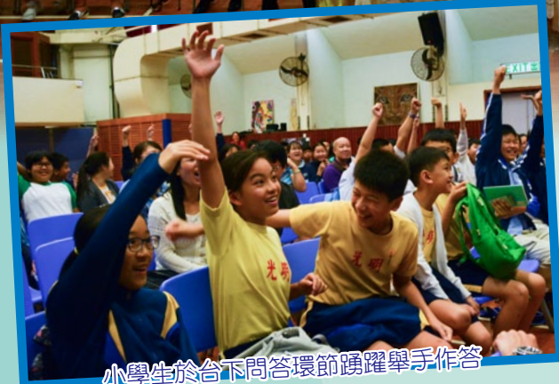
小學生於台下問答環節踴躍舉手作答

本校一直致力與社區建立友好的伙伴合作關係，貢獻社區。本年度除與社區機構，包括：聖雅各福群會、張木林區議員辦事處，協辦大型同樂日活動，為區內居民提供文娛活動，與眾同樂，亦協辦區內親子體能競賽活動「紅葉古道齊競賽」，透過親子體能競賽，推廣本土行山徑、自然風景、鄉郊文化及提升環保意識，並提倡勤做運動的家庭文化，競賽之餘兼具教育意義。