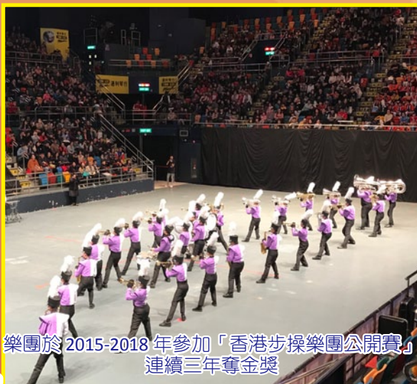
樂團於 2015-2018 年參加「香港步操樂團公開賽」連續三年奪金獎