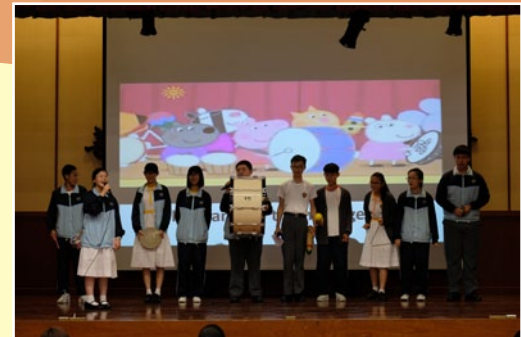
All S1-S3 classes gathered at the hall and performed for one of the most eye-catching English Fest activities, Storytelling Competition.