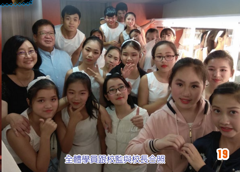
全體學員跟校監與校長合照