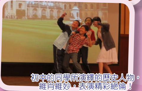
初中的同學所演繹的歷史人物，維肖維妙，表演精彩絕倫！