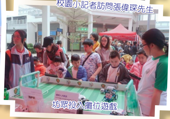
坊眾投入攤位遊戲