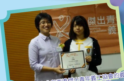
本組推薦學生參與香港傑出青年義工協會的義工領袖培訓計劃，開拓同學的眼界