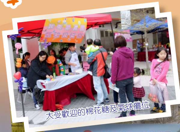
大受歡迎的棉花糖及氣球攤位