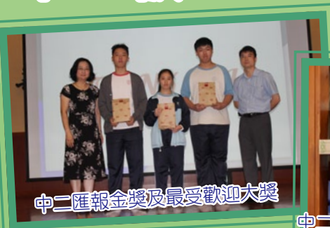
中二匯報金獎及最受歡迎大獎