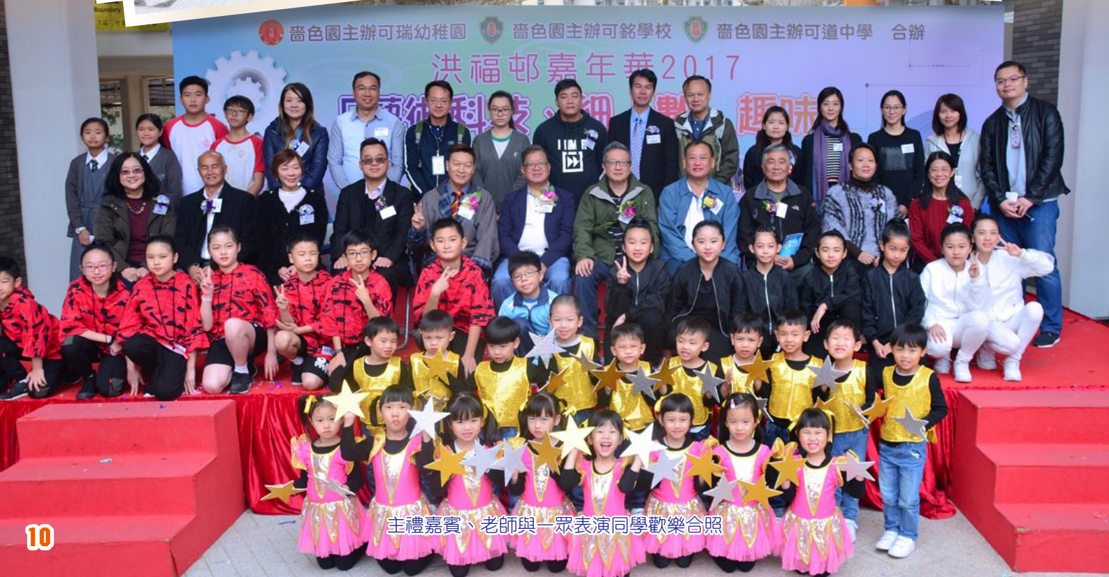
主禮嘉賓、老師與一眾表演同學歡樂合照