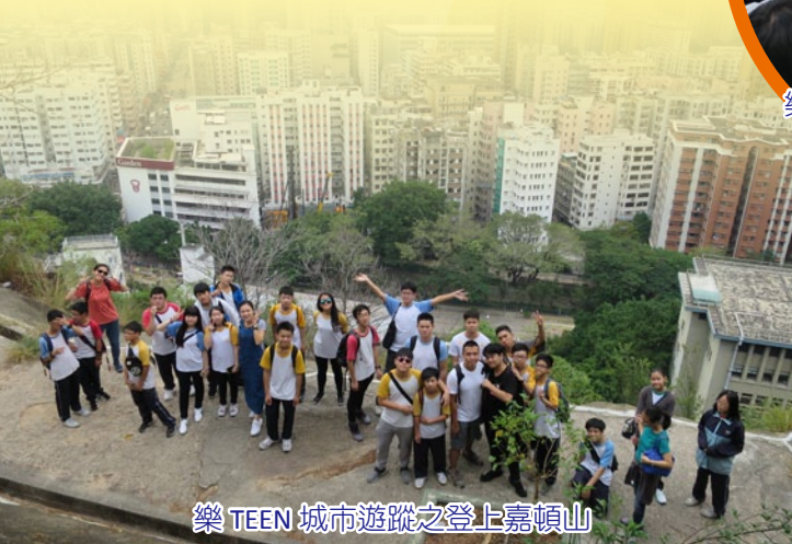
樂TEEN 城市遊蹤之登上嘉頓山