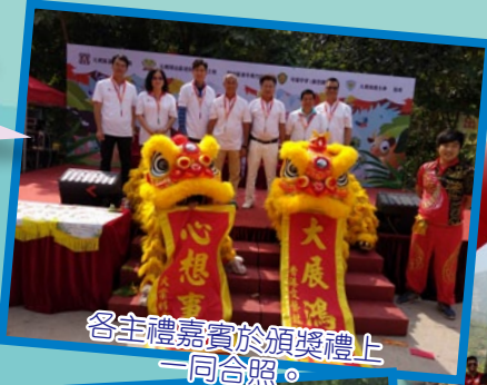
各主禮嘉賓於頒獎禮上一同合照。