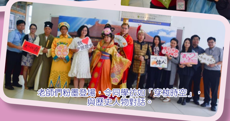
老師們粉墨登場，令同學彷彿「穿梭時空」，與歷史人物對話。