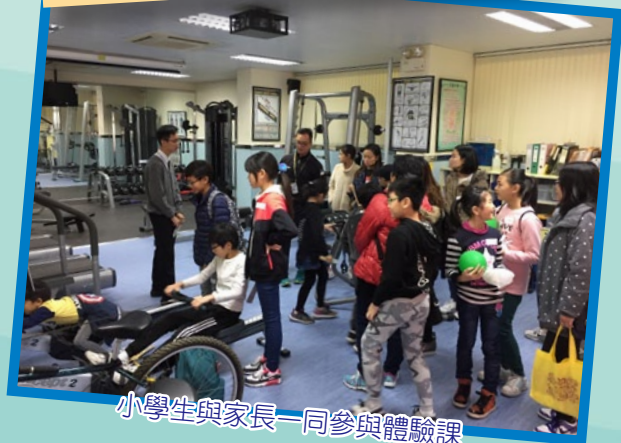
小學生與家長一同參與體驗課