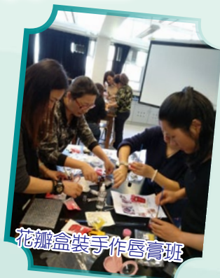
花瓣盒裝手作唇膏班

為了培養學生關心社會及慈善公益的價值觀，本會特意舉辦了「裹糰同樂日」及「校內義賣愛心糰」，校內師生踴躍認購，籌得款項全數撥捐香港公益金作慈善用途。