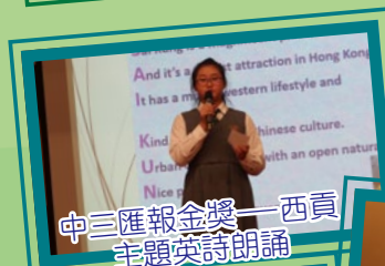
中二匯報金獎——西貢 主題英詩朗誦