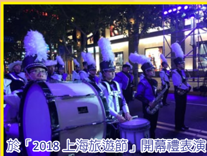
於「2018 上海旅遊節」開幕禮表演