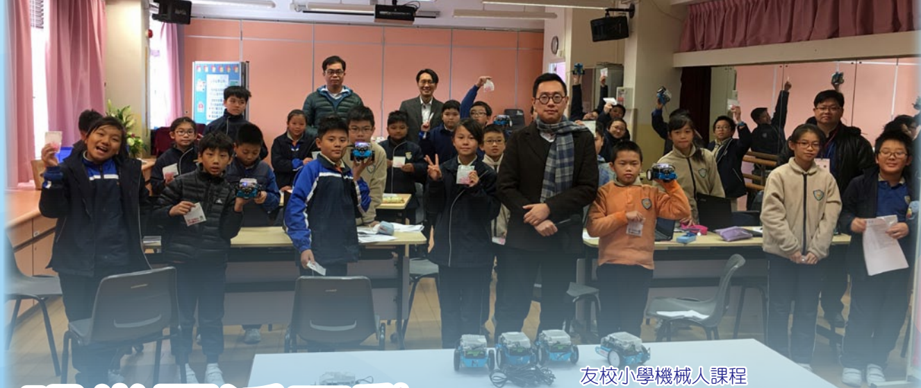
友校小學機械人課程