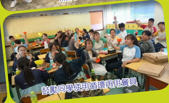
鼓勵同學使用循環再用餐具