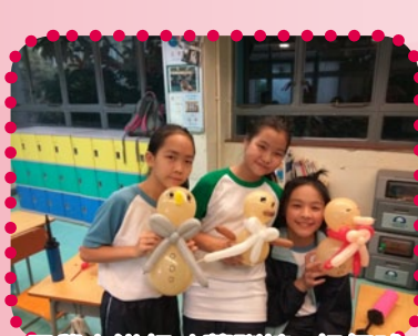
同學在進行才藝訓練 - 扭氣球

在升中適應上，我們透過手工製作聚會，讓初中同學建立正面的社群關係，加快適應學校生活，並培養同學對學校的歸屬感。