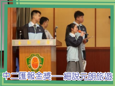
中二匯報金獎——細說元朗旅遊