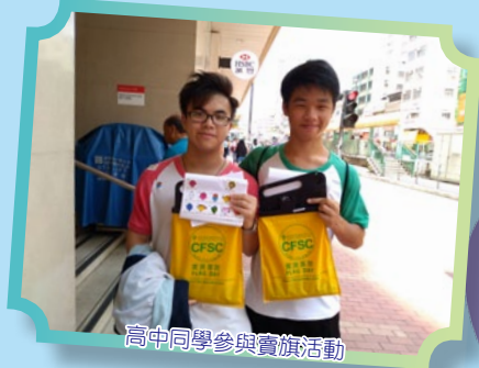
高中同學參與賣旗活動

服務學習組成立了義工小組已經兩年了，為學生提供不同類型的義工服務及訓練，讓同學從活動中提升自信及得到滿足感。本年度本組舉辦了義工講座、義工技巧培訓、長者義工服務、賣旗日等活動，漸漸聚集了一群熱心義工，定期參與義務工作，讓同學從活動中擴闊眼界，關心社會，培養同理心，學懂感恩。