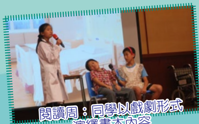
閱讀周：同學以戲劇形式 演繹書本內容