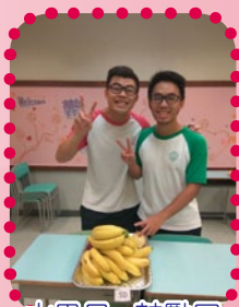
水果日 - 鼓勵同學關心身體，注意健康。

在健康教育方面，本年度舉辦了水果派對、水果攤位、健康週、健康講座、捐血日等，鼓勵同學關心身體，注意健康。除以上活動，更重要的是透過師生日常接觸，以生命影響生命，讓學生先懂得珍愛自己，進而關心及尊重別人，再延伸至社會，建立正面積極的人生態度。