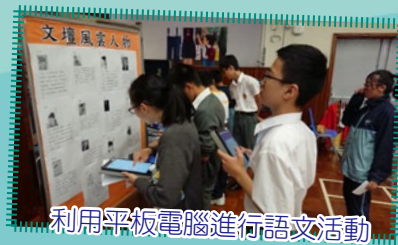
利用平板電腦進行語文活動