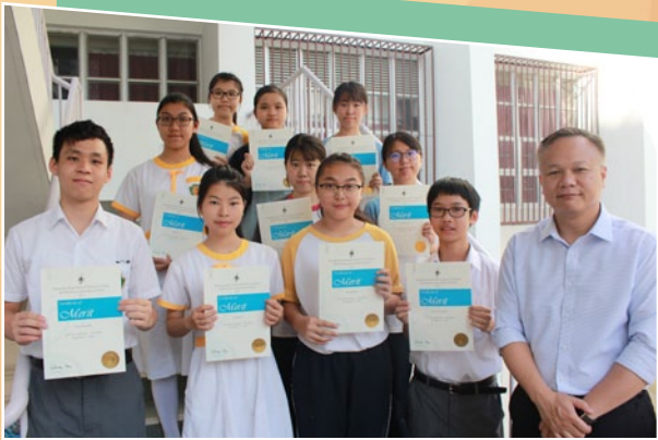
All contestants receive satisfactory results in Speech Festival.