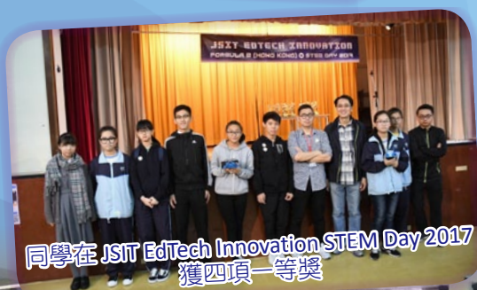
同學在 JSIT EdTech Innovation STEM Day 2017 獲四項一等獎

隨著 STEM 在教學中日形重要，本校除了成功申請優質教育基金撥款進行「STEM 實驗室計劃」外，更從多方面入手開展 STEM 教學，以「mBot 機械人大冒險」、「太陽能風扇」、「立體製作」等課題，讓同學在實踐中掌握相關的原理。此外，本校獲兩所區內小學邀請，在課餘時間為小五、六的同學舉辦課程，以富趣味的主题，發掘學生對科學技術的興趣，參加同學積極投入，效果理想。