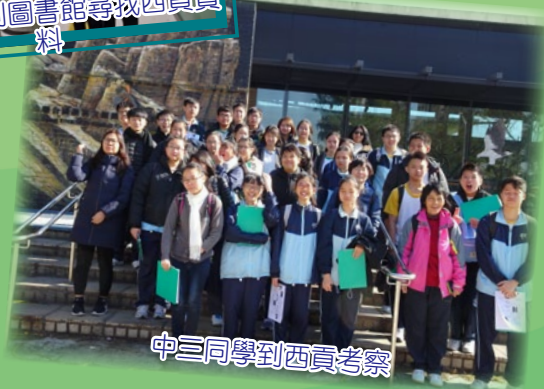
中三同學到西貢考察