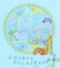
感恩紀念冊 - 培養學生常懷感恩心，常做感恩事。

在心靈發展方面，我們相信感恩是快樂的來源！本年度舉辦了感恩滿校園活動，當中包括一分鐘感恩、我在生命遇見你 - 給家人的信、生命留言冊、感恩紀念冊等，培養學生常存感恩之心，感受他人善意與關懷，並能加以回報。