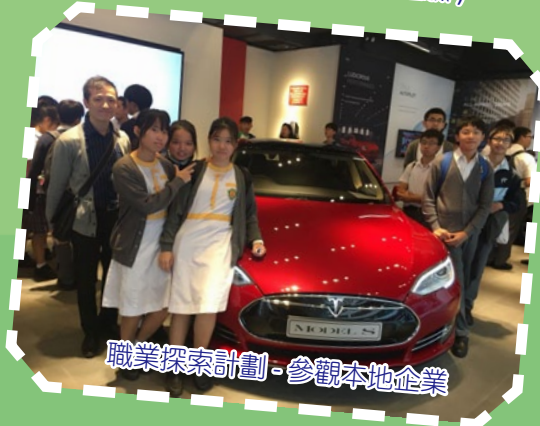
職業探索計劃 - 參觀本地企業