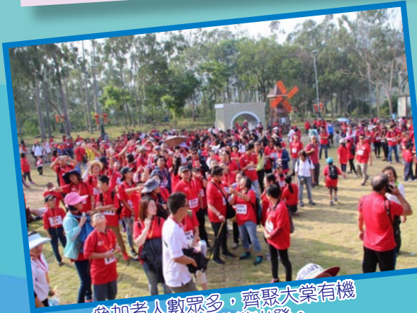
參加者人數眾多，齊聚大棠有機生態園，準備出發。