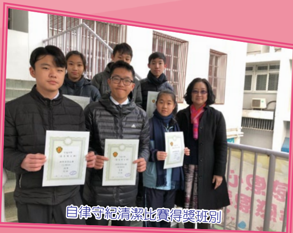
自律守紀清潔比賽得獎班別