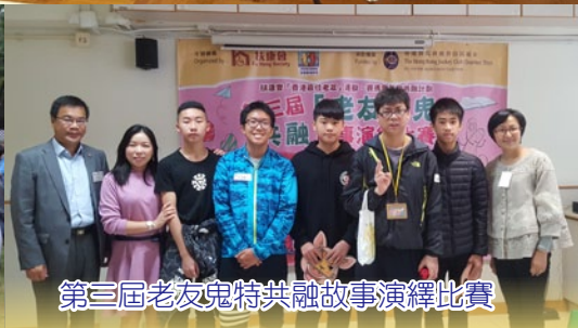
第三屆老友鬼特共融故事演繹比賽