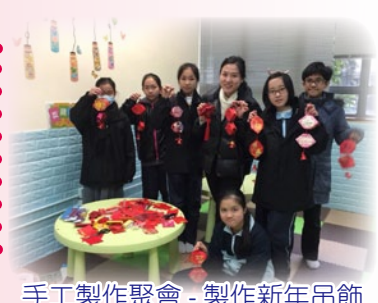
手工製作聚會 - 製作新年吊飾