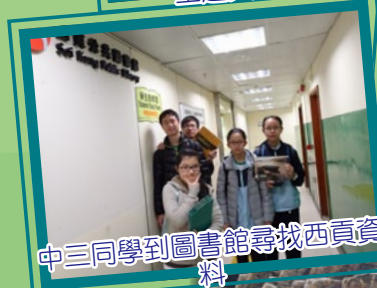
中三同學到圖書館尋找西貢資料