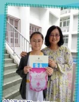
普通話散文獨誦 冠軍