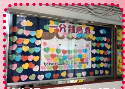
一分鐘感恩 - 培養學生常存感恩之心

在升中適應上，我們透過手工製作聚會，讓初中同學建立正面的社群關係，加快適應學校生活，並培養同學對學校的歸屬感。