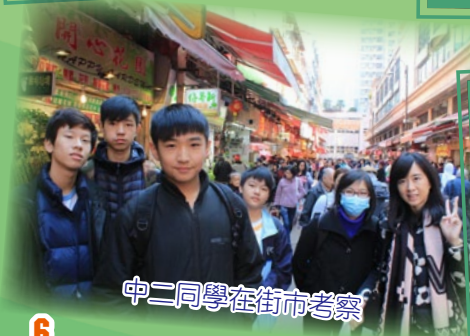
中二同學在街市考察