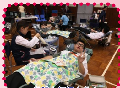
身體力行捐血救人