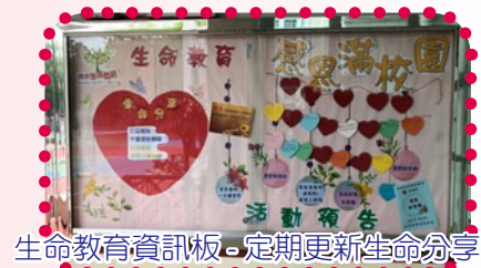
生命教育資訊板 - 定期更新生命分享