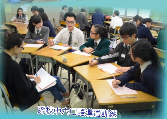
聯校中六口語溝通訓練