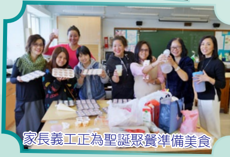
家長義工正為聖誕聚餐準備美食