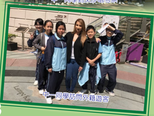
中一同學訪問外籍遊客