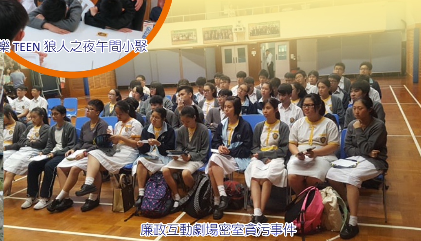
廉政互動劇場密室貪污事件