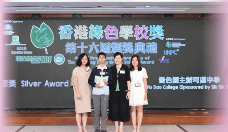
榮獲第十六屆香港綠色學校獎銀獎

本校致力通過多元化的活動讓學生在生活中實踐環保理念，如班際種植活動、環保互動劇場、參觀有機農莊、參觀香港首個自給自足的污泥設施「T·PARK」、環保攤位、魚菜共生工作坊、魚菜共生收成大典、聯歡會使用循環再用餐具獎賞活動等，藉此提高學生的環保意識，身體力行，響應環保。憑著全校師生及家長的努力，本校獲環境運動委員會頒發第十六屆「香港綠色學校獎」銀獎及「環境卓越大獎」優異獎。