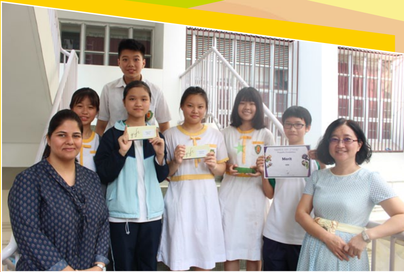
Our school won a Merit award and the Audience award in Hands On Puppetry Competition.

Further to consolidate their knowledge and skills, regular English Café activities and various meaningful inter-class competitions were held. Our teaching faculty is greatly impressed by the active participation and students' progress thus made.