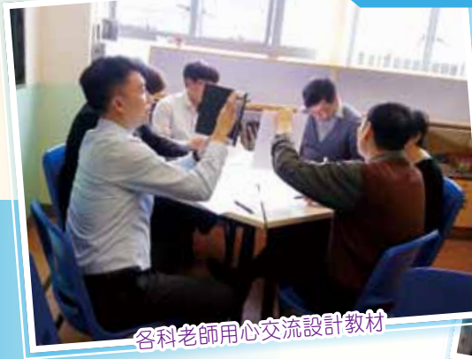
各科老師用心交流設計教材