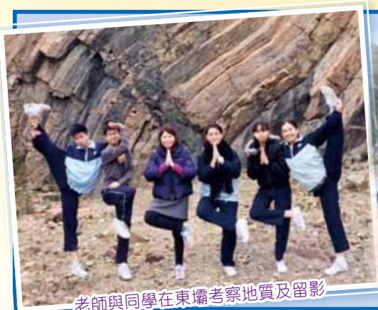
老師與同學在東壩考察地質及留影