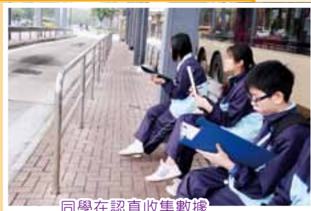
同學在認真收集數據

以「洪水橋尋·真·趣」為題，讓同學運用他們在科學、數學、電腦和設技所學的知識，在洪水橋不同的地點勘測和收集區內的交通、噪音、水質、流動網絡等情況的數據，加以分析，以了解周遭環境對人民生活的影響，藉此反思環保等問題，以及洞悉社區人民的生活質素。