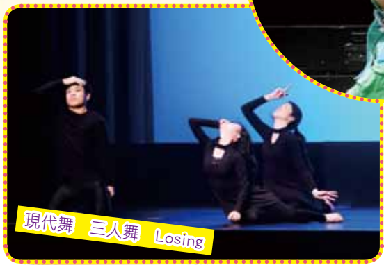
現代舞 三人舞 Losing