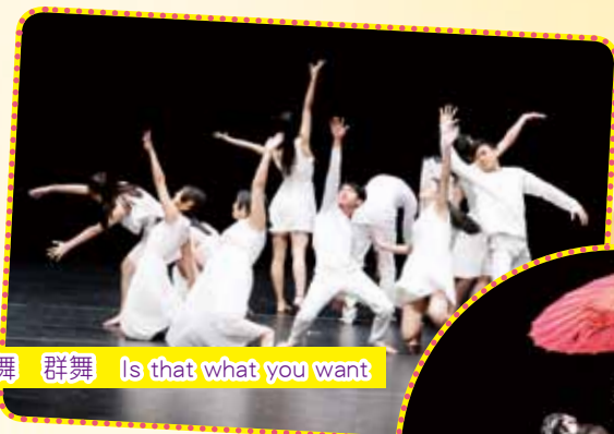
現代舞 群舞 Is that what you want

舞蹈組各隊員憑著對舞蹈藝術的誠意，本學年共排練了8支舞蹈，於2017年1月17至2月16日期間，參加由香港學界舞蹈協會與教育局聯合主辦的「第53屆學校舞蹈節」，共獲得3甲4乙的理想成績。當中中國舞的賽事，更全獲得甲等獎，確實可喜可賀。