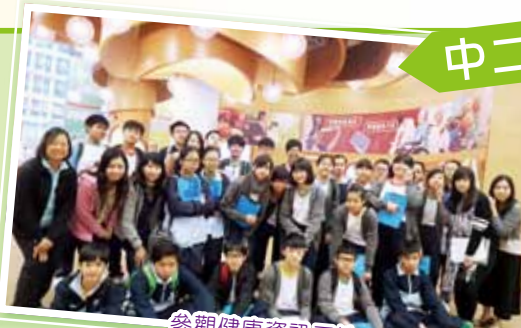
參觀健康資訊天地