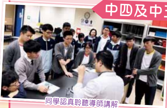
同學認真聆聽導師講解