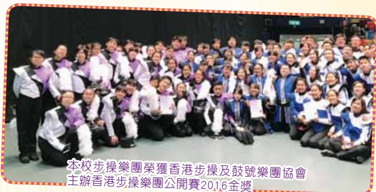
本校步操樂團榮獲香港步操及鼓號樂團協會主辦香港步操樂團公開賽2016金獎