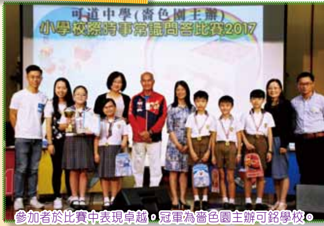
參加者於比賽中表現卓越，冠軍為齋色園主辦可銘學校。