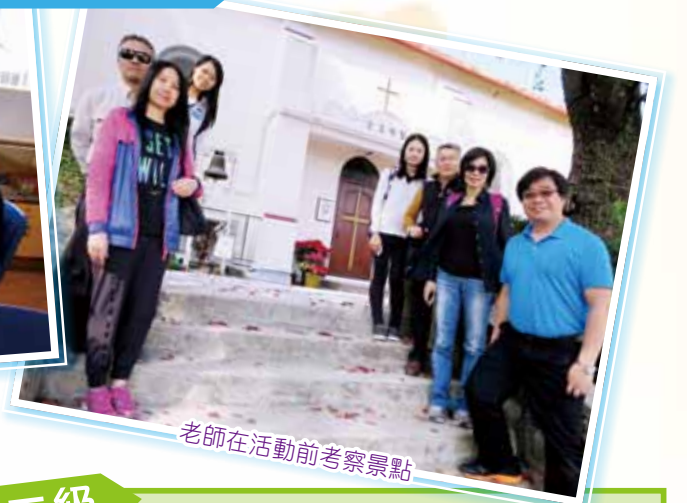
老師在活動前考察景點