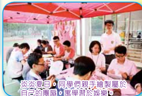
炎炎夏日，同學們親手繪製屬於自己的團扇，寓學習於娛樂。