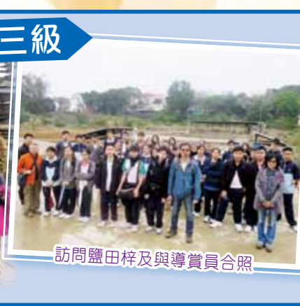
訪問鹽田梓及與導賞員合照

以「西貢探知遊」為題，部分同學在西貢市區探尋它的歷史和經濟發展；部分同學乘船到鹽田梓發掘中西文化交流的宗教遺址，一覽昔日香港造鹽業的情況；部分同學則在東壩考察獨特的地質面貌，反思保育的意義。此活動增加了同學對文學、地理、歷史的興趣，讓他們體會西貢人民生活風俗和對大自然的愛護之情，以加深他們的識見與文化內涵。