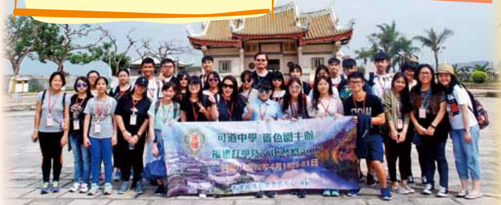
參觀著名景點集美學村，認識當地風土人情及生活面貌。