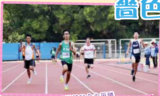
可道健兒全力爭勝