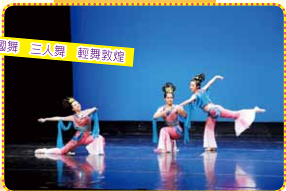
中國舞 三人舞 輕舞敦煌