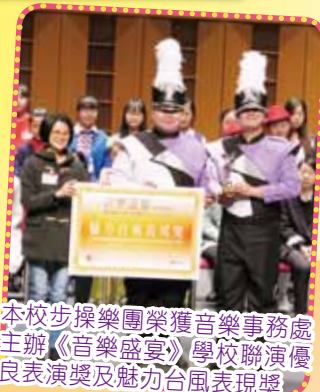
本校步操樂團榮獲音樂事務處主辦《音樂盛宴》學校聯演優良表演獎及魅力台風表現獎