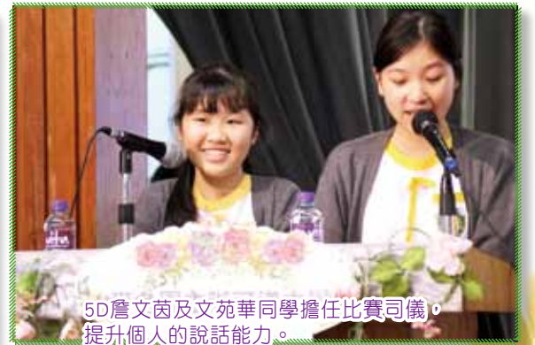
5D詹文茵及文苑華同學擔任比賽司儀，提升個人的說話能力。