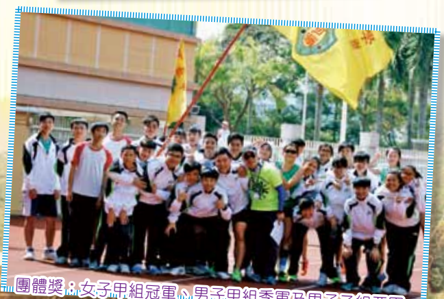
團體獎：女子甲組冠軍、男子甲組季軍及男子乙組亞軍