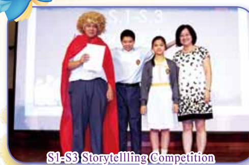
S1-S3 Storytelling Competition