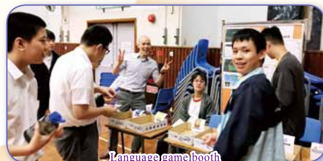
Language game booth