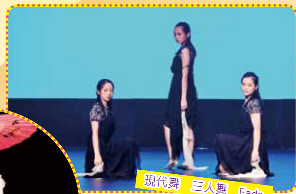
現代舞 三人舞 Fade