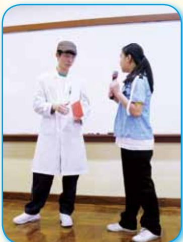
中三級故事演繹比賽動靜皆宜，同學們的裝扮惟肖惟妙！