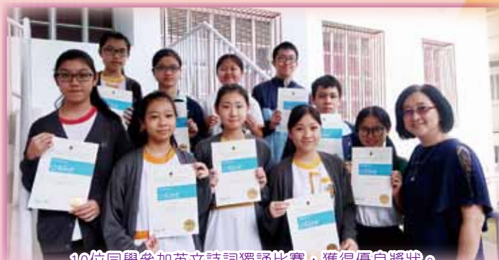
10位同學參加英文詩詞獨誦比賽，獲得優良獎狀。