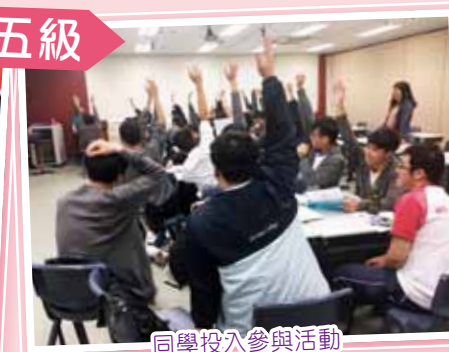
同學投入參與活動

在生涯規劃組老師的帶領下，高中同學分別到沙田及黃克競香港專業教育學院分校參觀，透過不同的講座和工作坊，讓同學了解更多升學資料及途徑，更進一步了解自己的能力和興趣，使他們能有效劃規出自己未來升學的路向和就業的目標。