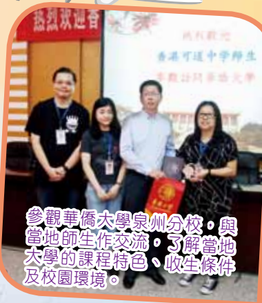
參觀華僑大學泉州分校，與當地師生作交流，了解當地大學的課程特色、收生條件及校園環境。

27位中四及中五級同學於2017年4月18至21日參與由生涯規劃組舉辦的「福建升學及文化考察團2017」。行程除安排參觀華僑大學泉州分校及集美大學外，更與當地師生交流，了解當地大學的課程特色。同時，亦參觀了不同景點，包括集美學村、古龍工業園、華安土樓等，認識當地風土人情及生活面貌。