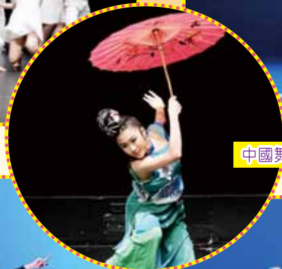
中國舞 獨舞 羽化靈蛇