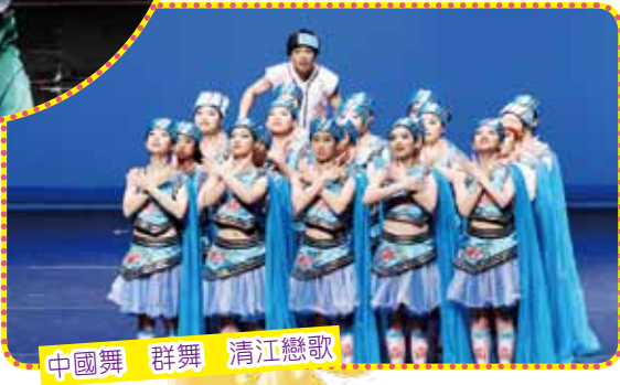
中國舞 群舞 清江戀歌