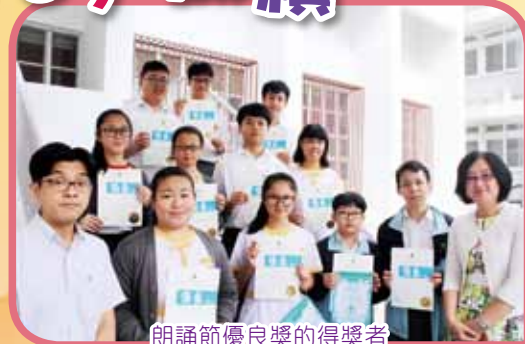
朗誦節優良獎的得獎者