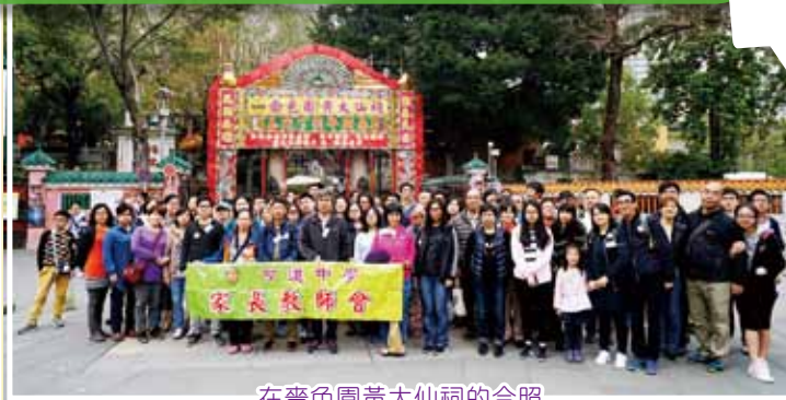
在薈色園黃大仙祠的合照