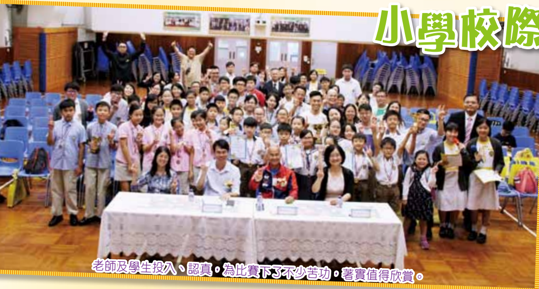
老師及學生投入、認真，為比賽下了不少苦功，著實值得欣賞。

為鼓勵學生關注時事及常識，並建設高小學生交流切磋的平台，本校於2017年5月6日舉辦「小學校際時事常識問答比賽」。比賽題目包括中文、英文、自然科學、時事通識、健康生活、香港法律、環境保護、中國國情等範圍。