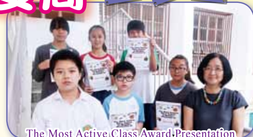
The Most Active Class Award Presentation