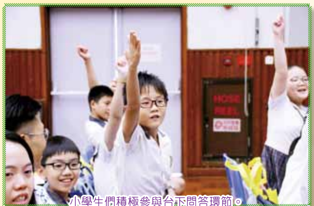
小學生們積極參與台下問答環節。

參與學校包括：齋色園主辦可銘學校、元朗寶覺小學及十八鄉鄉事委員會公益社小學。眾小學生於比賽中表現卓越，可見老師及學生的認真與投入，為比賽下了不少苦功，著實值得欣賞，相信學生在過程中能得著不少寶貴的知識與經驗。