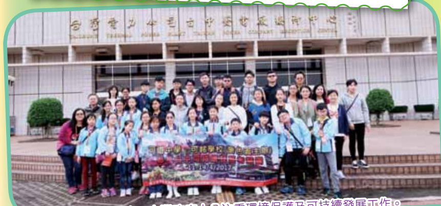
參觀台中發電廠，台灣政府十分注重環境保護及可持續發展工作。

本校於2017年4月11-14日與薈色園主辦可銘學校合辦「可道可銘聯校台中可持續發展考察團2017」。是次活動讓學生走出校園到訪台中，藉此比較香港與台灣在環境保育上的分別，亦能讓學生親親大自然，體驗鄉郊生活。