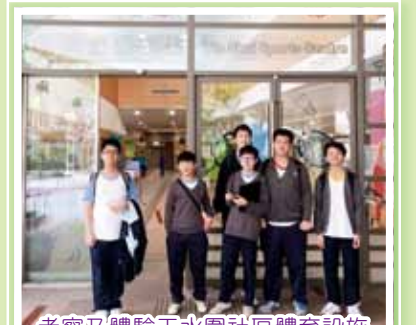
考察及體驗天水圍社區體育設施

以「建構健康生活」及「舊區活化與藝術」為主題，同學分別到了「健康資訊天地」了解食物營養與不同年齡人士的健康關係，並自設食譜烹調有營養菜，與老師和同學分享；有些同學在老師的帶領下，到了元朗及天水圍區考察區內的運動場館及設施，更親身在戶外上了一堂體育課；有些同學則到了上環的元創坊，探討古蹟活化和保育的知識，並與不同的藝術家和訪客交流心得，各活動均透過不同的互動，增進同學在通識、體育、藝術及音樂的知識。