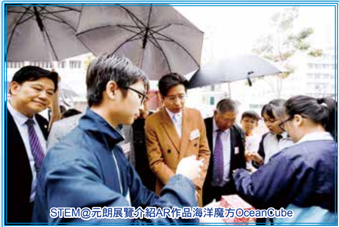
STEM@元朗展覽介紹AR作品海洋魔方OceanCube