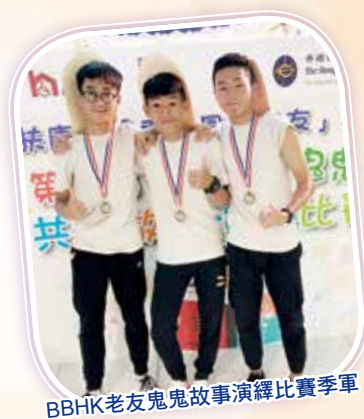
BBHK老友鬼故事演繹比賽季軍