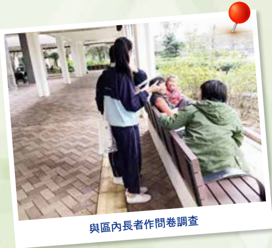
與區內長者作問卷調查