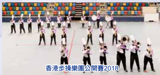
香港步操樂團公開賽2018