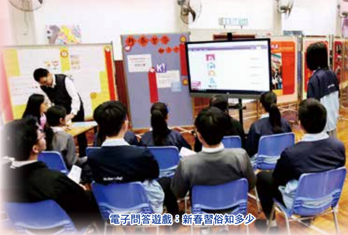
電子問答遊戲：新春習俗知多少