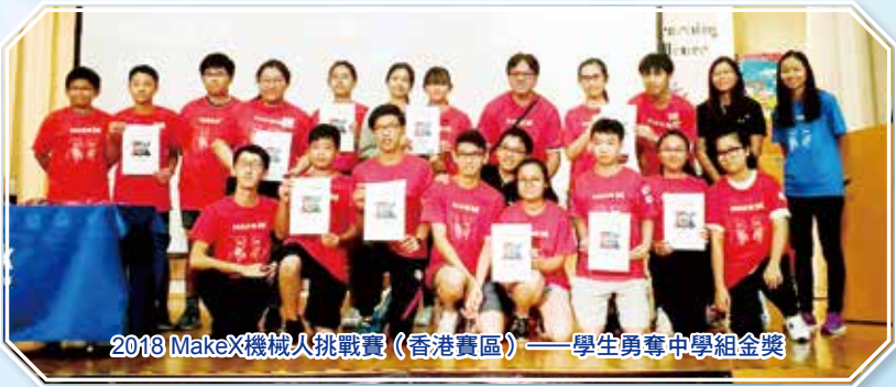
2018 MakeX機械人挑戰賽（香港賽區）——學生勇奪中學組金獎