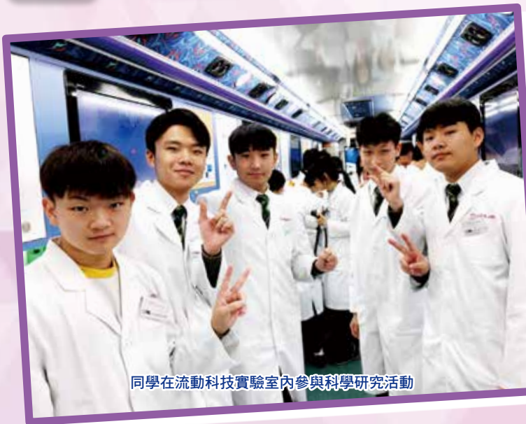
同學在流動科技實驗室內參與科學研究活動