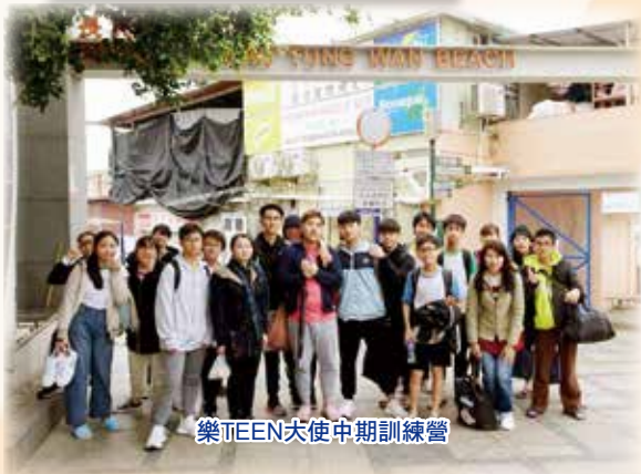
樂TEEN大使中期訓練營