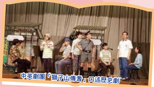
中英劇團「獅子山傳耆」口述歷史劇