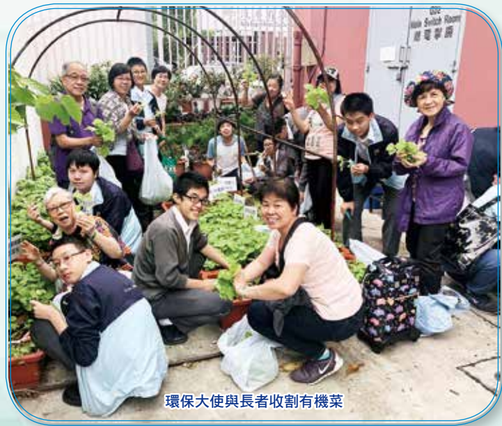
環保大使與長者收割有機菜