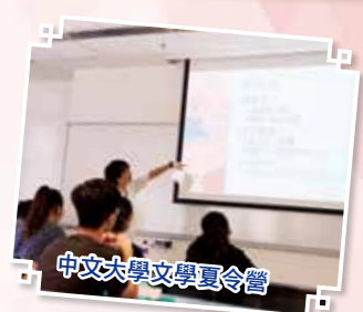
中文大學文學夏令營