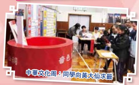
中華文化周：同學向黃大仙求籤