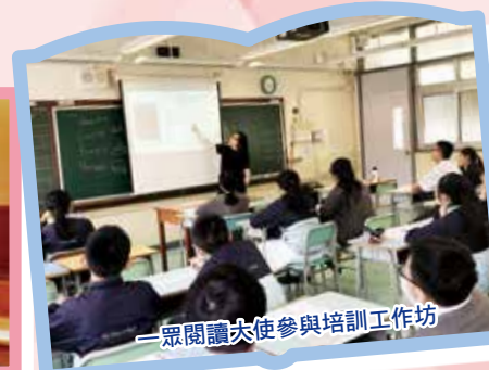
一眾閱讀大使參與培訓工作坊