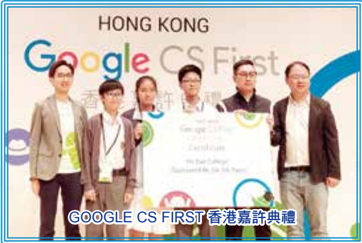
GOOGLE CS FIRST 香港嘉許典禮