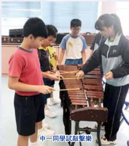
中一同學試敲擊樂

為了透過音樂藝術陶冶性情，令學生建立良好品格，有健康的身心發展及團隊精神。本校推行「中樂培訓計劃」開辦了以下樂器班，分別是笛子、二胡、琵琶、柳琴、中阮、古箏和揚琴，由個別專項導師小組教授。步操樂團更於「香港步操樂團公開賽2018」獲得銅獎，之後再參加由音樂事務處主辦的《漫遊音樂世界》學校聯演，憑出色的表現獲頒「優良表演獎」及「魅力台風表現獎」。本校合唱團也有好表現，在香港演藝音樂節2019團體音樂比賽中獲銀獎，讓學生增廣見聞、增強自信心及培養出團隊精神。