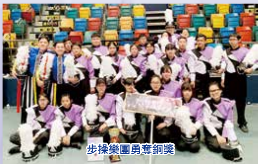
步操樂團勇奪銅獎