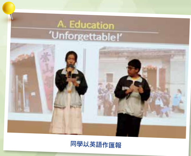
同學以英語作匯報

為了讓同學增廣見聞，走出課堂，把所學在真實的環境中應用，發展及運用跨學科的知識，提昇學習趣味，建立全人發展的共通能力。本校於下學期舉辦「全方位學習日」，中一至中三級的同學分別到不同地點進行研習，一些同學參觀富有文化藝術特色的場所，一些同學在街頭進行訪問，形式多元化。研習完畢後，各組在老師悉心指導下，進行初中級全方位學習匯報，把研習心得及成果向其他同學展示，提升校園的研習氣氛。