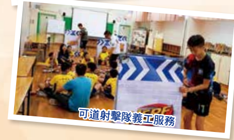
可道射擊隊義工服務