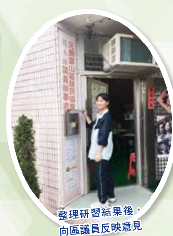
整理研習結果後，向區議員反映意見