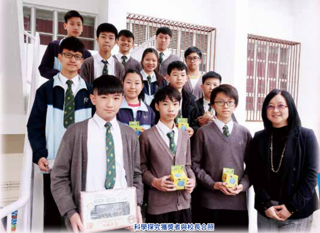
科學探究獲獎者與校長合照