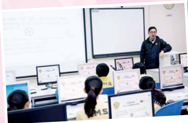
為兩所小學開辦的AR及VR故事創作比賽工作坊