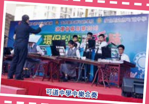
可道中學中樂合奏