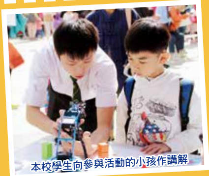
本校學生向參與活動的小孩作講解