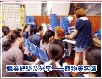
職業體驗及分享——寵物美容師