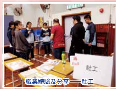
職業體驗及分享——社工