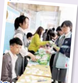
愛家人攤位——鼓勵同學在日常小事中表達對家人的愛

在心靈發展方面，我們相信感恩是快樂的來源！本年度舉辦了感恩滿校園活動，當中包括一分鐘感恩、我在生命遇見你——給家人的信、生命留言冊、感恩紀念冊等，培養學生常存感恩之心，感受他人善意與關懷，並能加以回報。同時，又舉辦不同的興趣班，讓初中同學能加快適應學校生活，培養歸屬感。