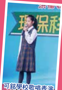
可銘學校歌唱表演