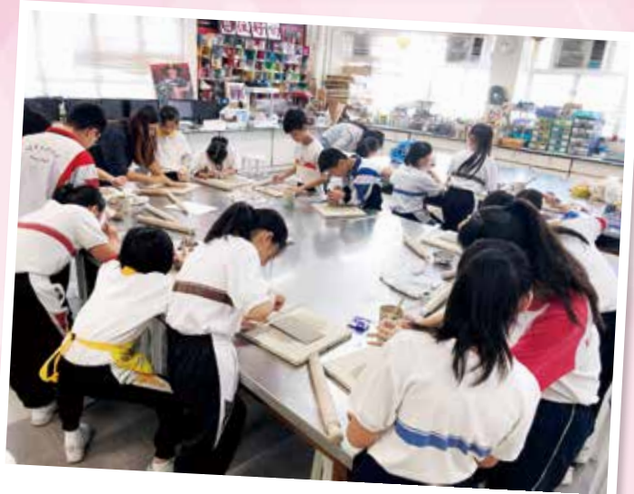
為小學生開設陶藝班

本校每年都舉辦「中一新生撰寫心意卡及回小學母校探老師」活動，讓學生懂得感恩，表達對老師的感謝之情，建立正面價值觀。活動得到小學校長及老師的讚賞。