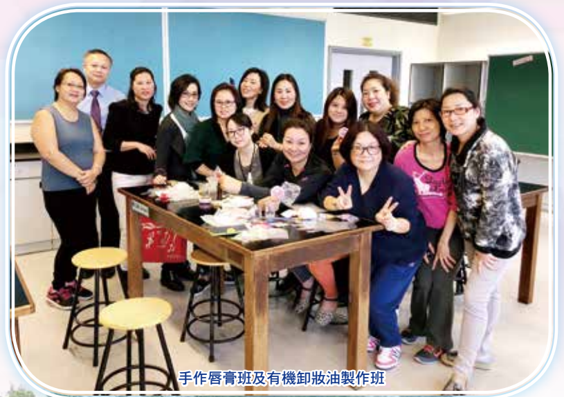
手作唇膏班及有機卸妝油製作班