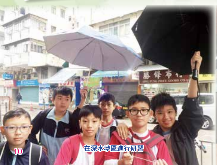
在深水埗區進行研習