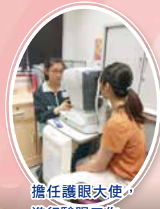
擔任護眼大使，進行驗眼工作