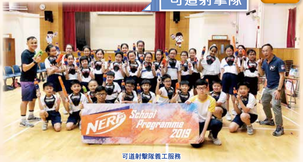
可道射擊隊義工服務