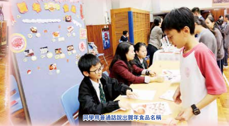
同學用普通話說出賀年食品名稱