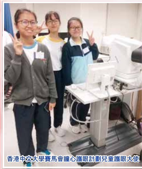
香港中文大學賽馬會瞳心護眼計劃兒童護眼大使