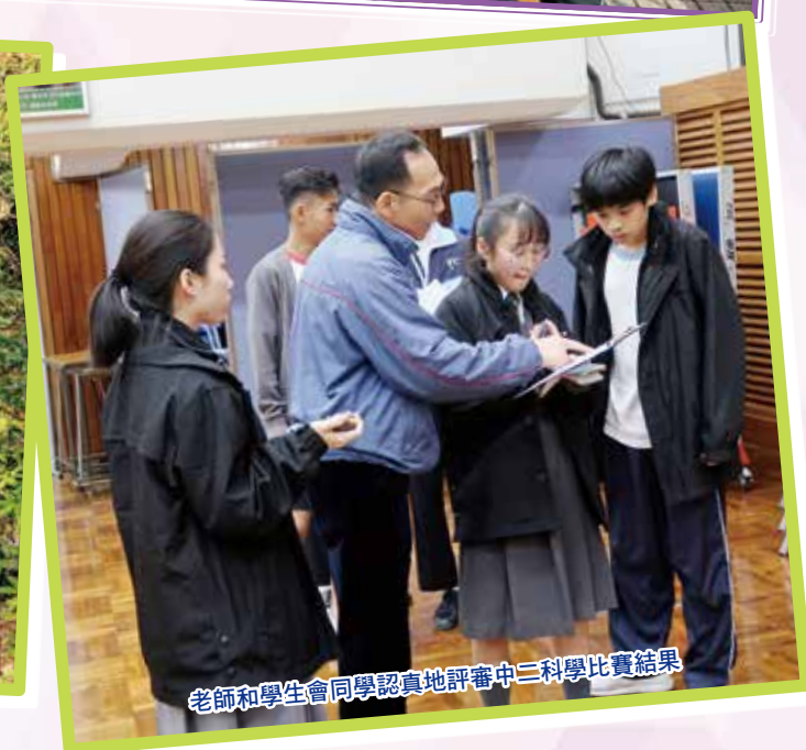
老師和學生會同學認真地評審中二科學比賽結果