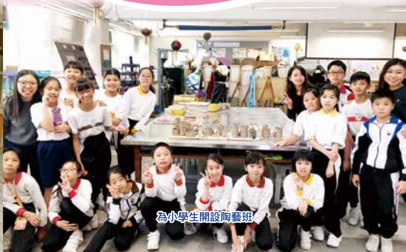
為小學生開設陶藝班