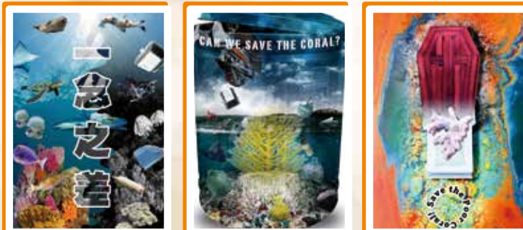
4B 吳蔚靈獲香港賽3等獎、國際賽3等獎的作品 4C 羅巧楠奪香港賽3等獎、國際賽2等獎的作品 4B 葉嘉慧奪香港賽3等獎、國際賽3等獎的作品

本校的視藝科積極推動學生參與多元化的藝術比賽，讓學生盡展所長，從而提升學生的自信。而本校的視藝科學生在不同的大大小小比賽中，不負所望，表現出色，屢獲殊榮，令人欣喜。