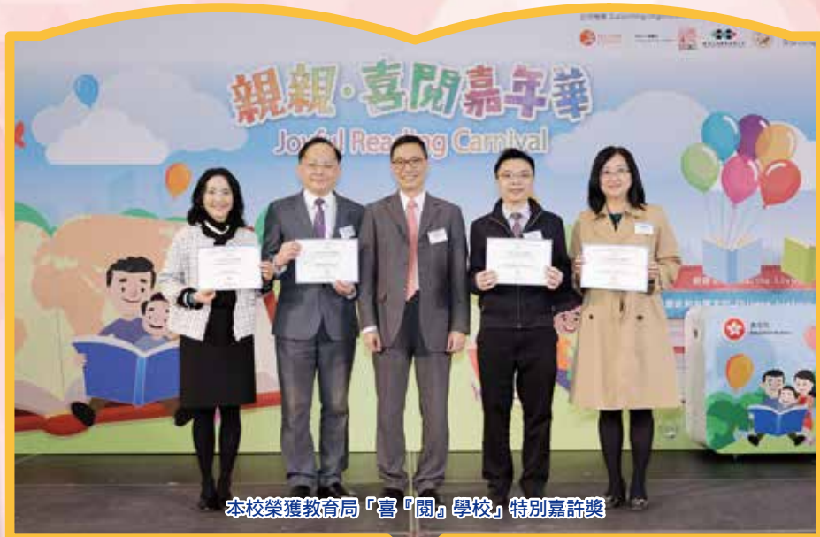
本校榮獲教育局「喜「閱」學校」特別嘉許獎