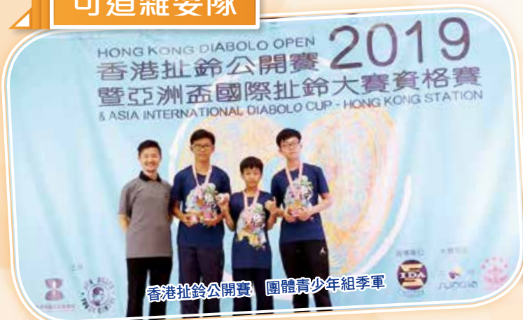
香港扯鈴公開賽 團體青少年組季軍