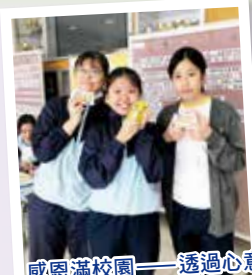
感恩滿校園——透過心意貼紙和飲品，向身邊同學表達感謝。