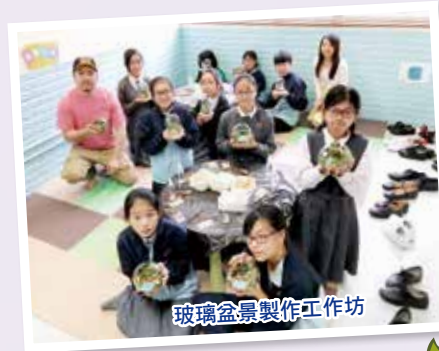
玻璃盆景製作工作坊