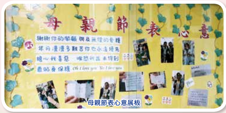
母親節表心意展板

本校以學生為本，用「心」對待學生。本年度以自律、尊重為品德主題，培育學生良好品格。此外，我們亦積極推動生命教育和健康教育，幫助同學發展健康的生活習慣，建立積極、有意義的人生。