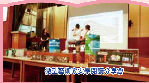
微型藝術家安泰閱讀分享會