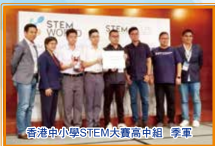
香港中小學STEM大賽高中組 季軍