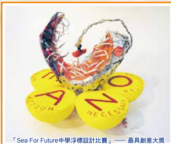
「Sea For Future中學浮標設計比賽」—— 最具創意大獎

本校的視藝科積極推動學生參與多元化的藝術比賽，讓學生盡展所長，從而提升學生的自信。而本校的視藝科學生在不同的大大小小比賽中，不負所望，表現出色，屢獲殊榮，令人欣喜。