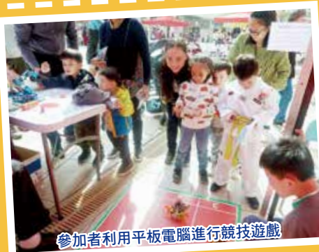
參加者利用平板電腦進行競技遊戲