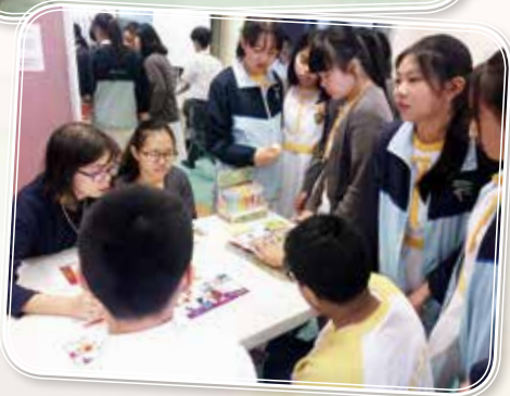
English Ambassadors took the helm at student-led language booths guiding their peers through their language learning journey.