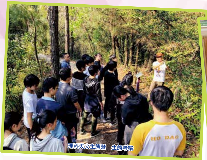
理科天文生態營 生態考察