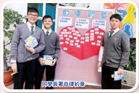
同學簽署自律約章