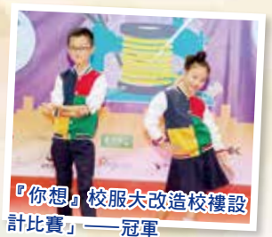
『你想』校服大改造校樓設計比賽——冠軍