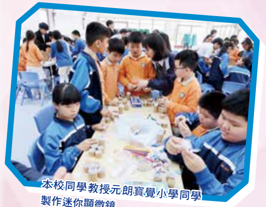
本校同學教授元朗寶覺小學同學 製作迷你顯微鏡