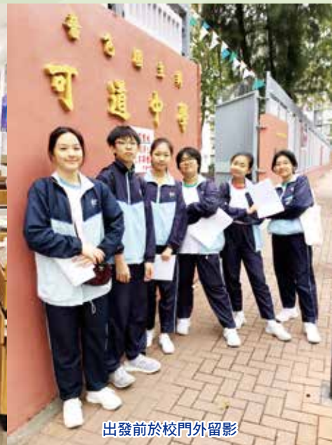
出發前於校門外留影