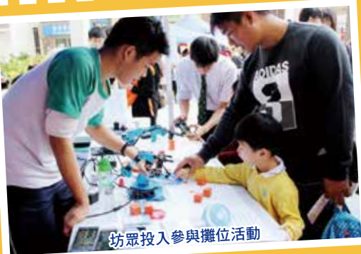
坊眾投入參與攤位活動