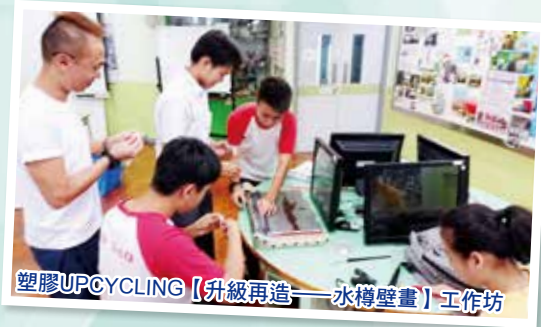
塑膠UPCYCLING【升級再造——水樽壁畫】工作坊