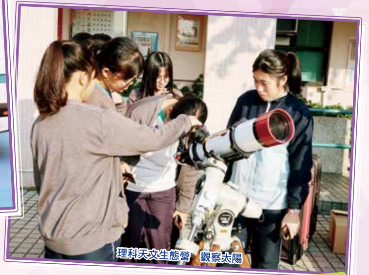
理科天文生態營 觀察太陽