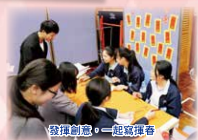
發揮創意，一起寫揮春

中文科努力創設全方位的語文學習環境。除了日常課堂外，亦舉辦多元化的活動，讓學生多使用語文，提升同學學習語文及普通話的信心和興趣。活動包括中華文化周、書畫班及攤位遊戲等活動。