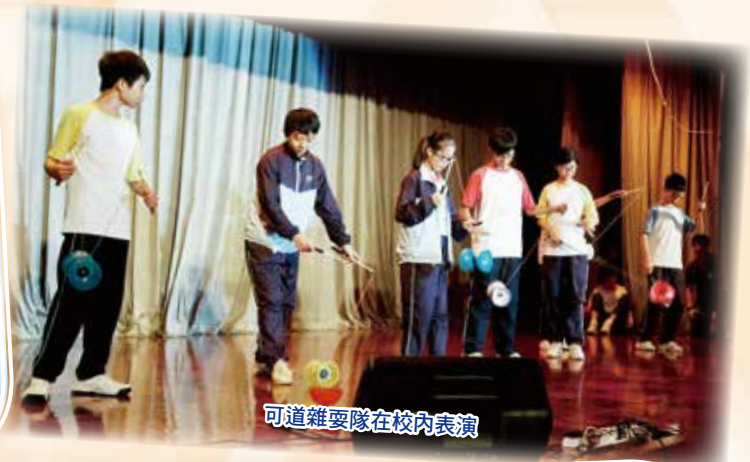
可道雜耍隊在校內表演