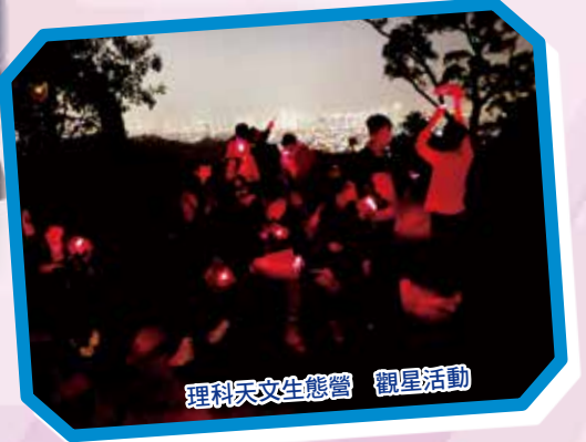
理科天文生態營 觀星活動