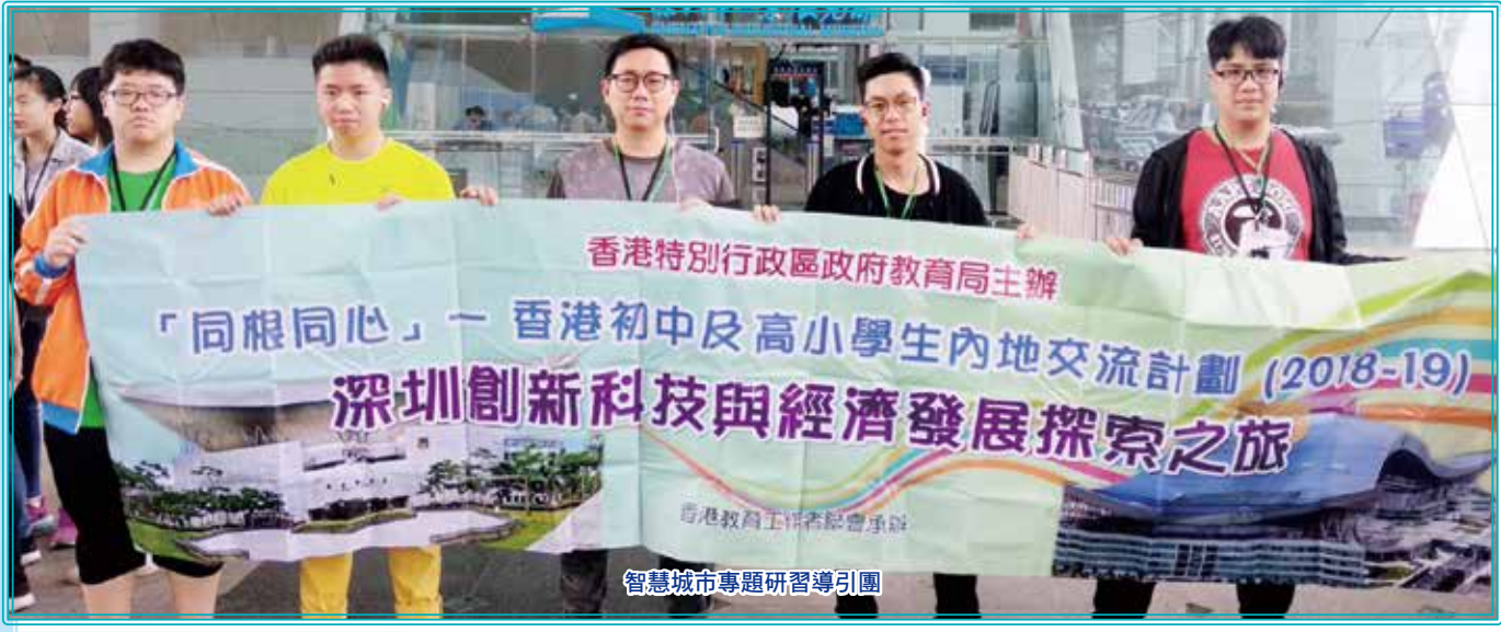
智慧城市專題研習導引團