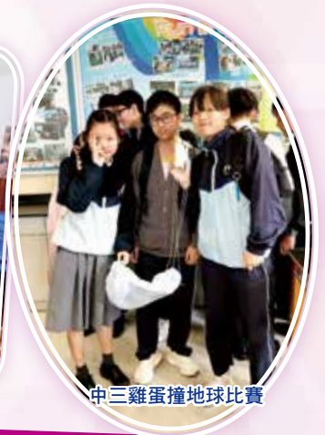
中三雞蛋撞地球比賽