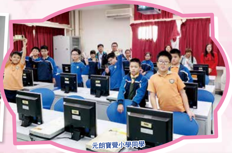
元朗寶覺小學同學