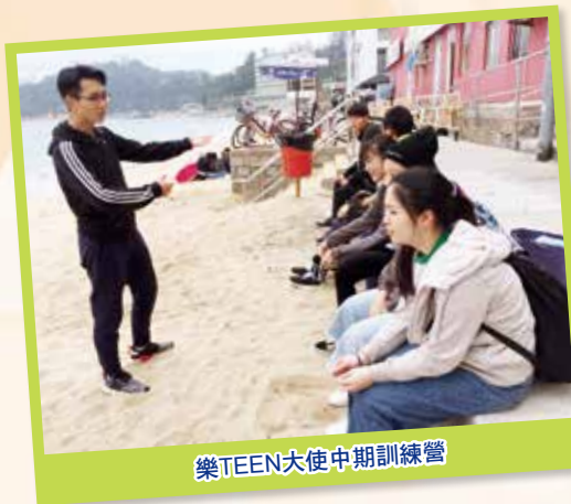
樂TEEN大使中期訓練營