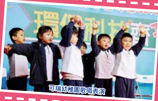
可瑞幼稚園歌唱表演

嘉年華歷時四個半小時，為洪福邨居民提供不少文娛活動，除多個以環保及科技為主題的攤位活動外，亦精心安排了三校學生進行各項的表演，如舞蹈、歌唱、中樂演奏、雜耍等，為場內帶來了無數歡樂氣氛，也讓三校的同學展現個人潛能，發揮平日所學以回饋社區。在風和日麗的星期六下午，坊眾人潮如湧，各人盡興而歸。