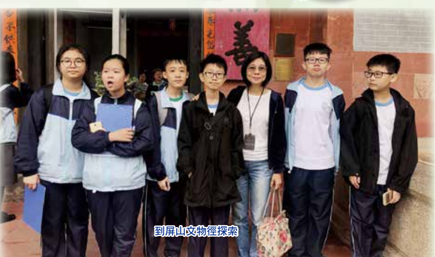
到屏山文物徑探索