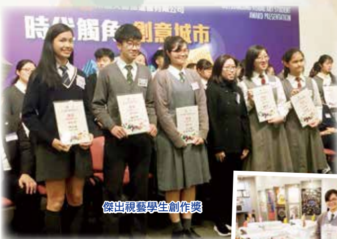
傑出視藝學生創作獎