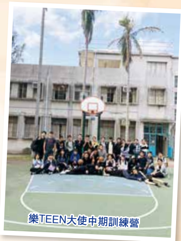
樂TEEN大使中期訓練營