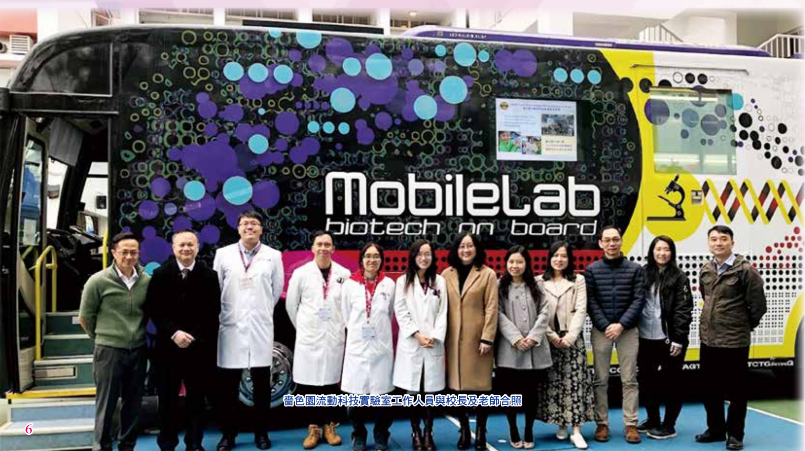
耆色園流動科技實驗室工作人員與校長及老師合照