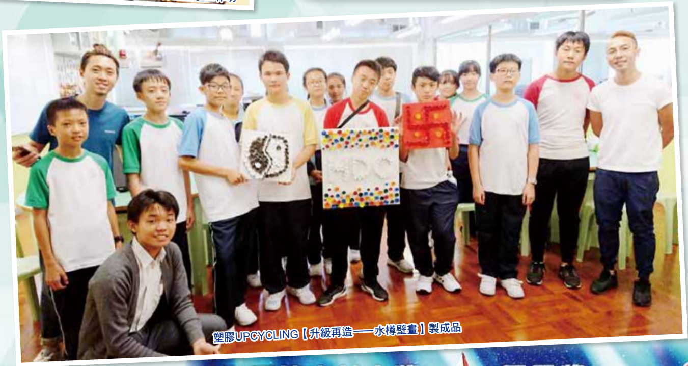
塑膠UPCYCLING【升級再造——水樽壁畫】製成品

香港環境卓越大獎 Hong Kong Awards for Environmental Excellence 2018