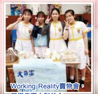
Working Reality賣物會，同學售賣自製美食