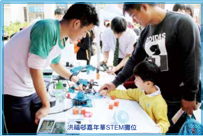
洪福邨嘉年華STEM攤位