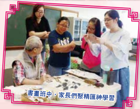
書畫班中，家長們聚精匯神學習