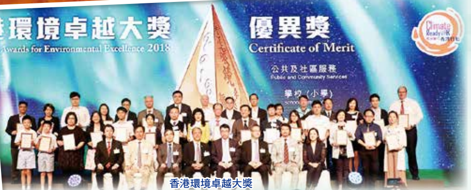
香港環境卓越大獎