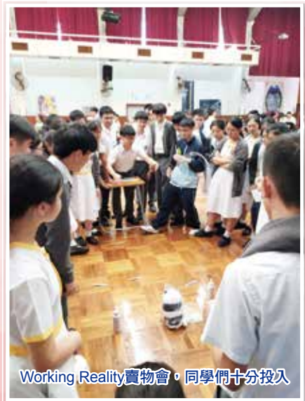
Working Reality賣物會，同學們十分投入