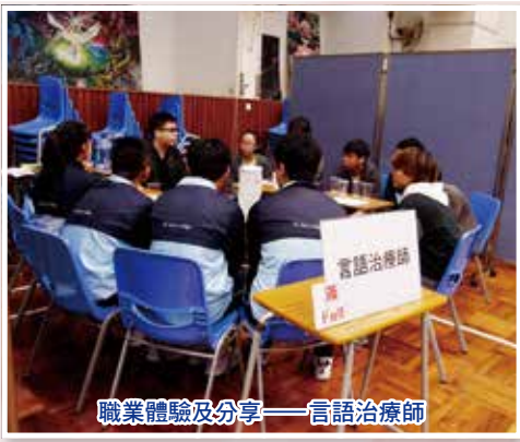
職業體驗及分享——言語治療師

生涯規劃組透過舉行不同類型的升學及就業輔導活動，如：升學講座、職業探索、參觀大專院校、工作見習計劃、參觀企業及小組輔導活動等，協助學生了解自己、發掘潛能；繼而認識社會，及早訂立不同的人生目標。