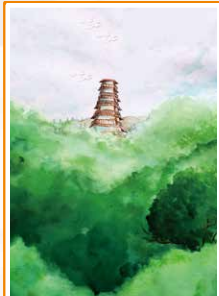
「全港青少年繪畫日比賽2018」——元朗區優勝作品