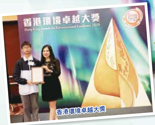
香港環境卓越大獎