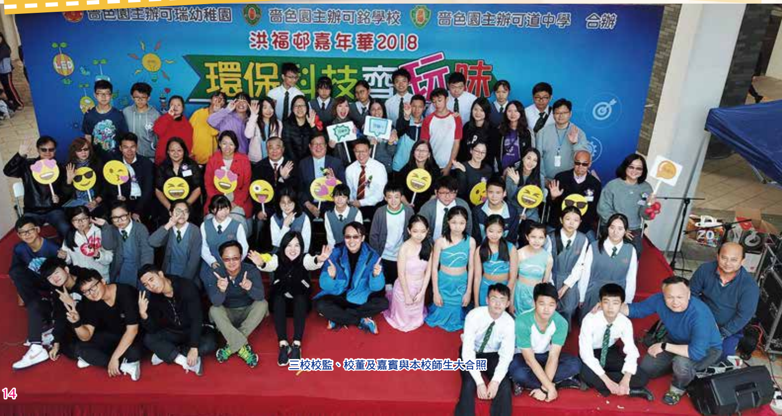
三校校監、校董及嘉賓與本校師生大合照