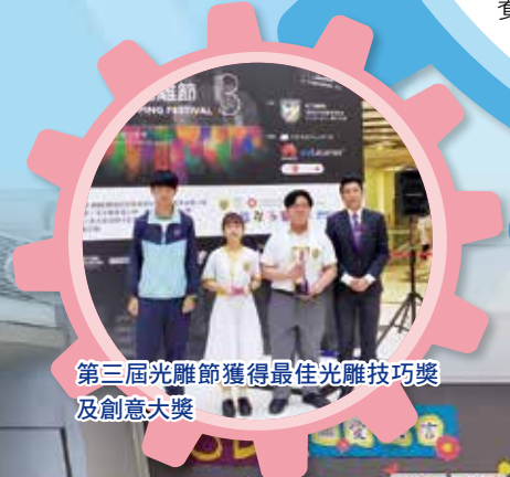
第三屆光雕節獲得最佳光雕技巧獎及創意大獎