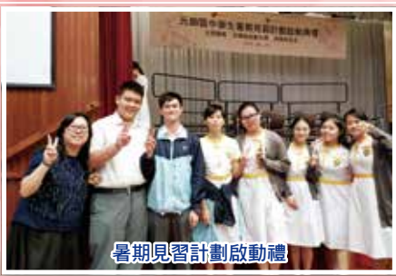
暑期見習計劃啟動禮