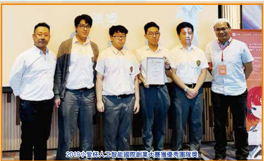
2019小愛杯人工智能國際創業大賽獲優秀團隊獎