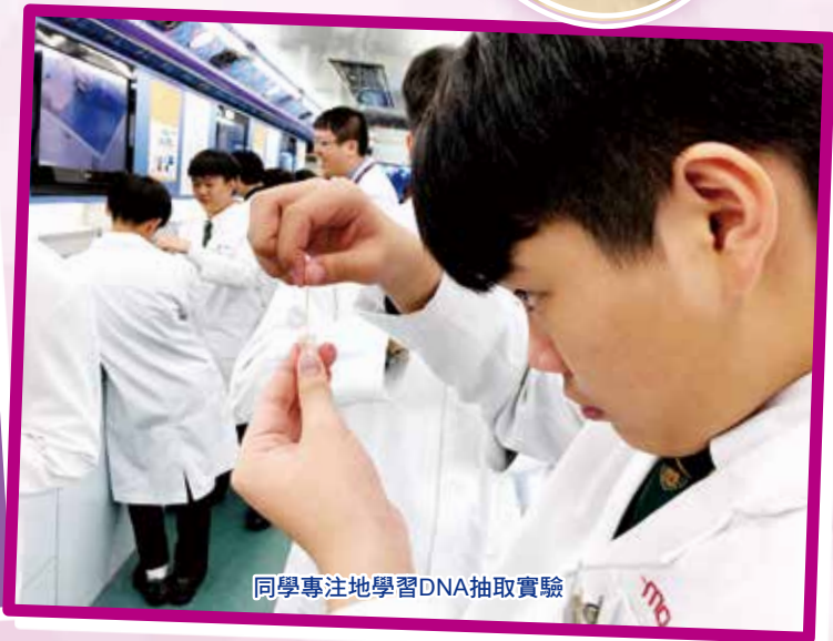
同學專注地學習DNA抽取實驗