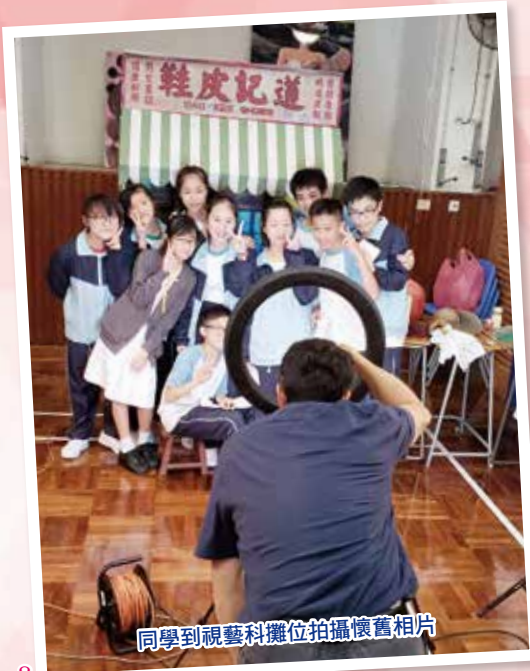
同學到視藝科攤位拍攝懷舊相片