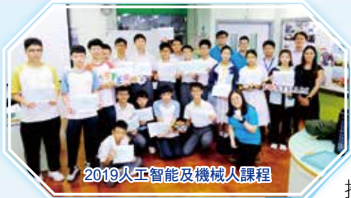
2019人工智能及機械人課程