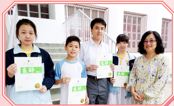
獲得良好獎的同學合照