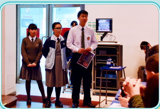
學生向評判匯報作品

本校為一群喜愛科技，熱衷實踐，分享技術及交流的學生，成立了「可道創客聯盟」。經多次討論及實習，終奪得由香港電腦教育學會舉辦的「學習如此多紛 2018 iGeneration Hong Kong」初中組冠軍及最佳創意獎，得獎作品為智能警衛及iKey智能鎖。