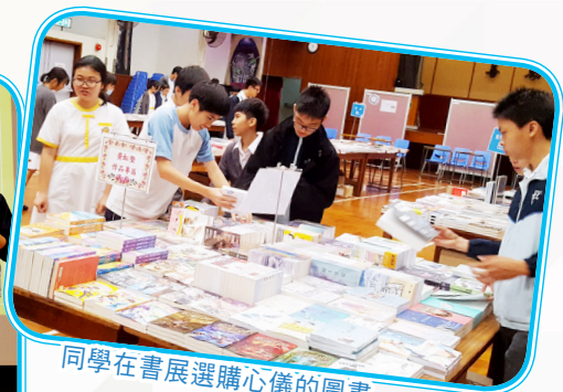
同學在書展選購心儀的圖書