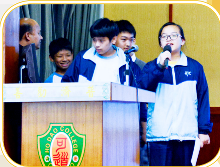
中一銀獎作品：香港藝術場所的對稱學

本校於2018年3月9日（星期五）舉辦「全方位學習日」，在老師跨科協作下，讓同學走出課室，在真實的情境中，發展及運用跨學科的知識，提昇學習趣味及建立全人發展的共通能力。初中三級分別在3月21至23日進行全方位學習匯報，旨在讓學生展示在研習當日的心得或成果。初中級共有四隊取得由校長和老師評審的匯報金獎，分別是中二級介紹元朗舊墟及中三級介紹西貢墟文化考察的組別，另設有由同學選出的最受歡迎大獎，足見是次活動學習成果斐然。