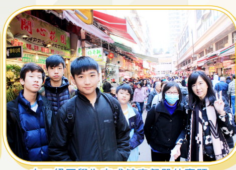
中二級同學為完成健康餐單的專題，特意到元朗街市考察。