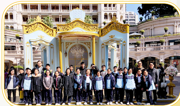
中一同學到尖沙咀考察