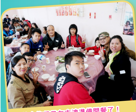
家教會旅行日在吉澳準備開餐了！