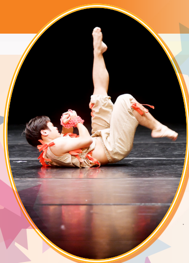
同學投入演繹舞蹈角色，抬腿姿勢充滿力量！