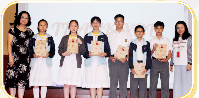
中一最受歡迎大獎（林慧琴老師組）