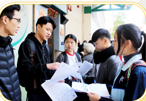
中二同學在出發考察前，先計劃行程。