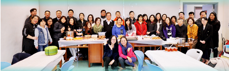
繽紛美食迎聖誕大合照，一桌都是豐富的美食。