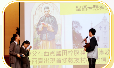
中三金獎作品：介紹西貢客家村落與教會的關係