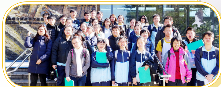
中三同學去西貢考察