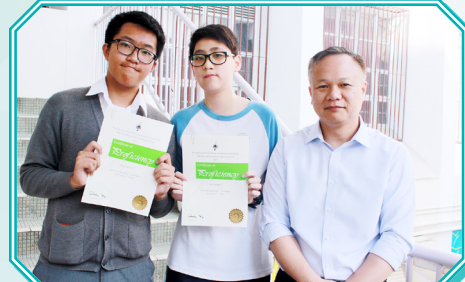
英文詩詞獨誦比賽良好獎狀