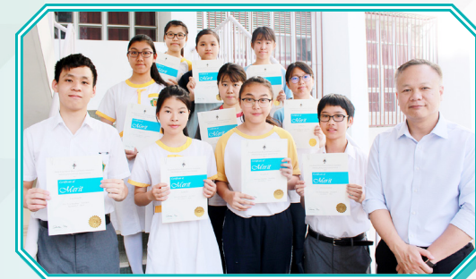
英文詩詞獨誦比賽優良獎狀