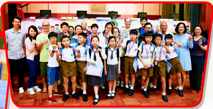
參賽學生與家長及老師賽後合照