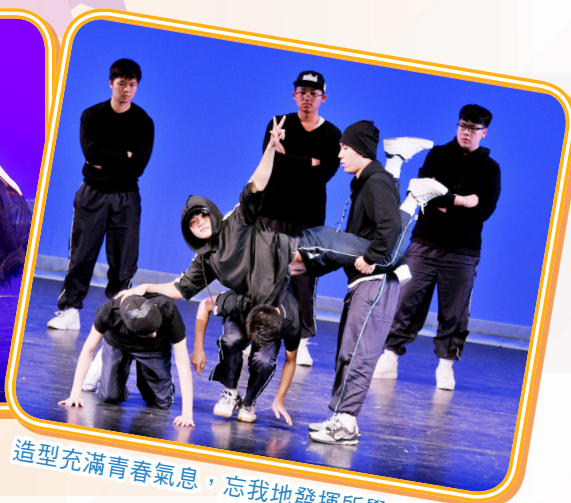
造型充滿青春氣息，忘我地發揮所學的舞技！