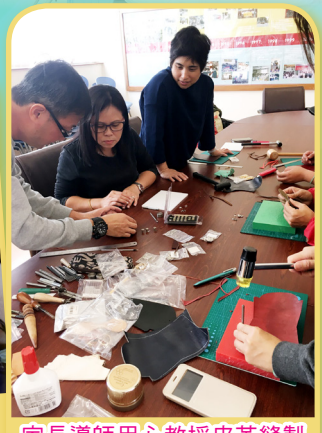
家長導師用心教授皮革縫製技巧，當中的用具真不少！