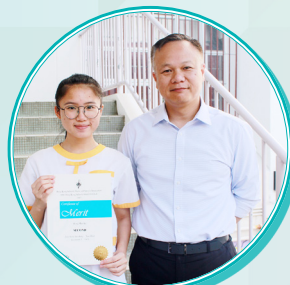
英文詩詞獨誦比賽亞軍