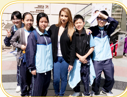
中一同學熱情地與外國遊客交流