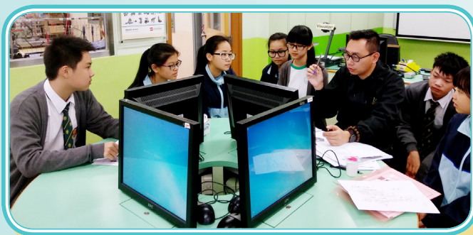
師生們正在構思作品