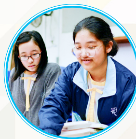
學生買手為校內同學挑選新書，真期待快些可以在圖書館借閱！