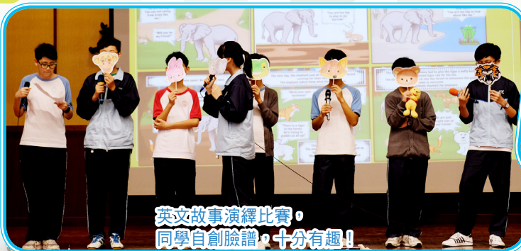
英文故事演繹比賽，同學自創臉譜，十分有趣！