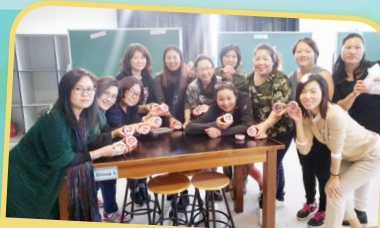
家長們拿著顏色鮮豔的唇膏製成品，十分漂亮！