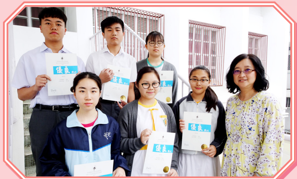
獲得優良獎的同學合照