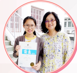
普通話散文獨誦 亞軍