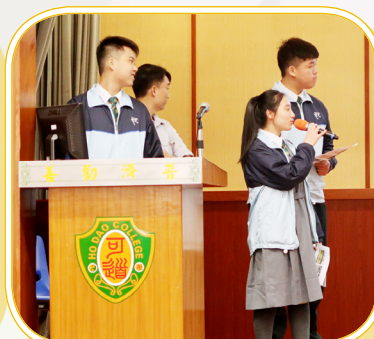
中二金獎作品：元朗舊墟行