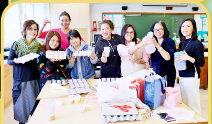
各家長投入準備美食，變身為廚神。