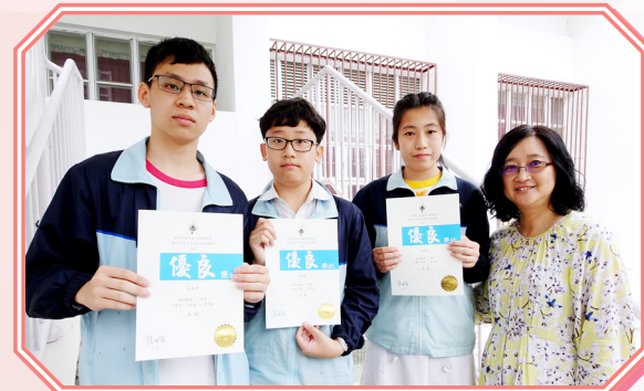
獲得季軍的同學合照

本校英文科參加第六十九屆香港學校朗誦節英文詩詞獨誦比賽，成績優良，獲獎名單如下：