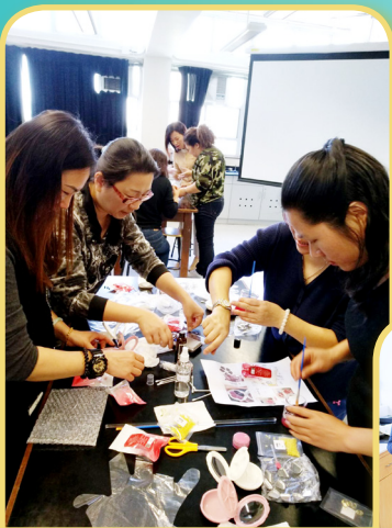
家長們投入製作唇膏，慢慢把口紅調出來！

一年一度的「家長教師會旅行日」已順利舉行，一行百多人乘船遊覽鴨州、吉澳、東坪洲，觀賞香港獨有的天然景色、品嚐鮮味漁村菜餚，一同舒展身心，渡過美滿的週末。