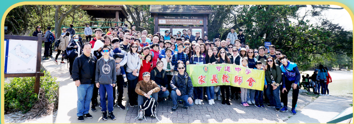
本年度家教會旅行在坪洲的大合照