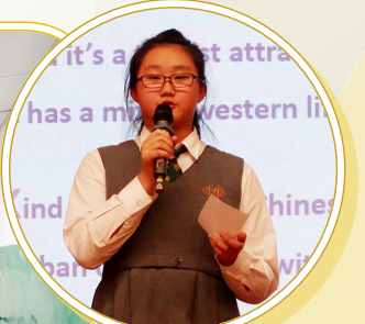
中三金獎作品：英詩朗誦