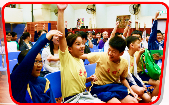
台下問答環節，小學同學踴躍參與