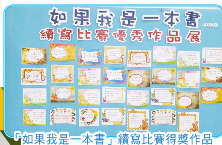
「如果我一本書」續寫比賽得獎作品

圖書館在2018年5月7至11日，以「好奇一小步·人類一大步」為主題，一連舉辦了五天的閱讀周，精彩活動包括：