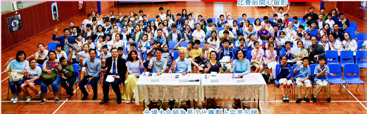
全場大合照為是次比賽劃上完美句號