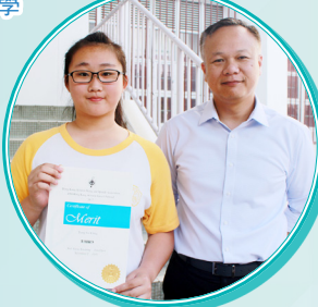
英文詩詞獨誦比賽季軍