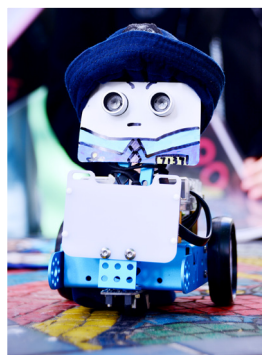
冠軍作品——智能警衛

本校為一群喜愛科技，熱衷實踐，分享技術及交流的學生，成立了「可道創客聯盟」。經多次討論及實習，終奪得由香港電腦教育學會舉辦的「學習如此多紛 2018 iGeneration Hong Kong」初中組冠軍及最佳創意獎，得獎作品為智能警衛及iKey智能鎖。