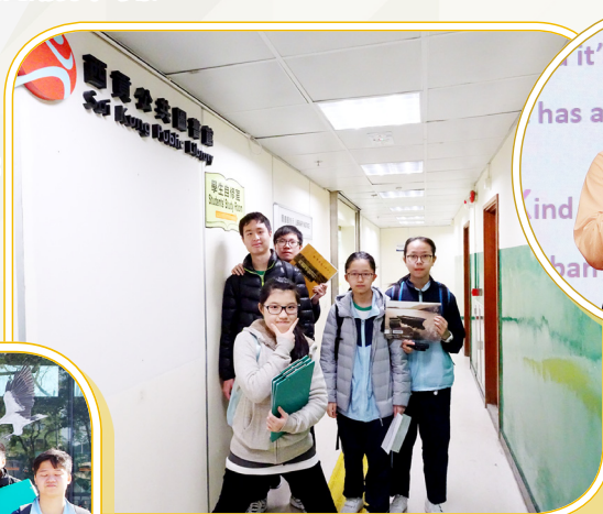
中三同學到圖書館尋找有關西貢的資料