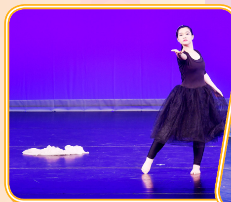
你願意與我共舞嗎？