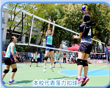
本校代表落力扣球

本校於2018年3月13日主辦嗇色園中學聯校女子排球比賽。當天各屬校包括可立、可風、可藝、可譽及本校的女子排球隊，雲集本校進行女子排球交流活動。全日賽事過程緊湊，各隊爭持激烈，打氣聲此起彼落，場面熱鬧。經過五輪賽事，比賽在歡樂的氣氛下圓滿結束。成績如下：