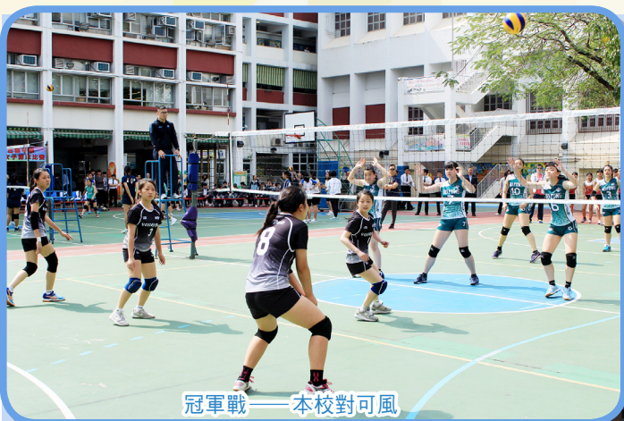
冠軍戰——本校對可風