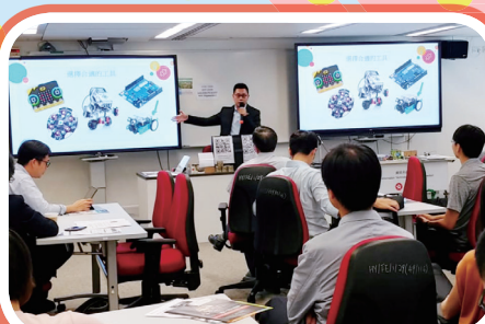
本校鄭老師到教育局分享物聯網研習心得