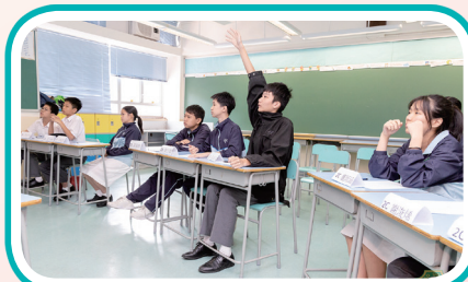
中二同學踴躍參與