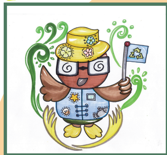
得獎作品 6C 薛嘉莉