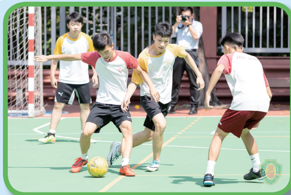
在足球場上，球員互相攔截。