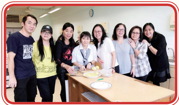
家長們在準備「繽紛美食迎聖誕」