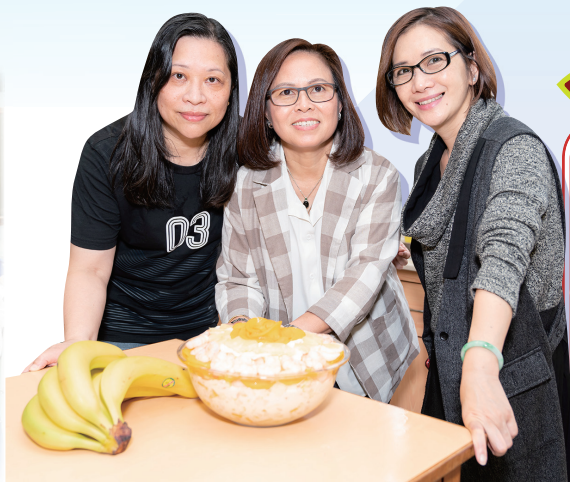
家長們的巧手製作出美味的甜品