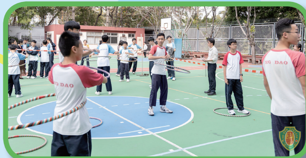
呼拉圈比賽中，同學們熟練地擺動身體。