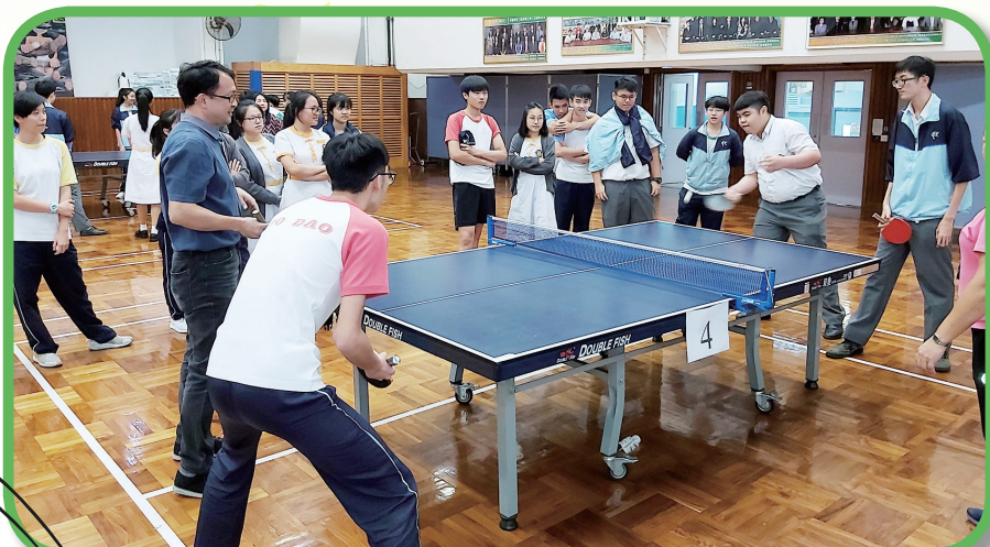
在乒乓球桌上，老師及學生打成一片。