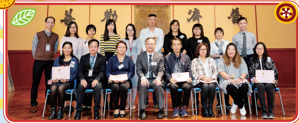
頒發委任狀予第十二屆家長教師會常務委員