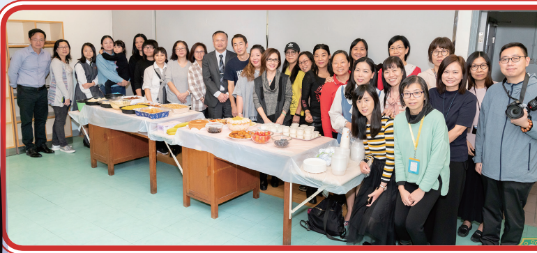
「繽紛美食迎聖誕」家長和師生們大合照