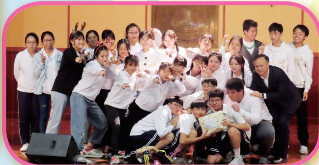
最搞笑獎得獎同學