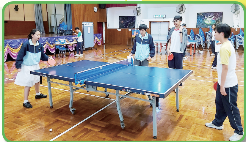
乒乓球女子組進行比賽