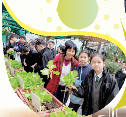
班際有機耕作活動