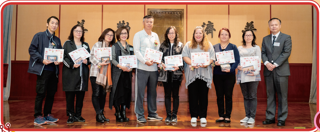
致送感謝獎及紀念品予第十一屆家長教師會常務委員