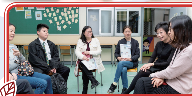
家長與班主任會面