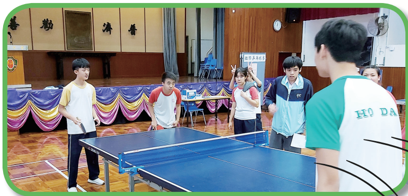
男子雙打比賽中，球員全神貫注。