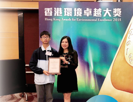
獲香港環境卓越大獎