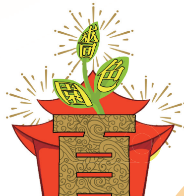
優異作品 6D 鍾焯琳