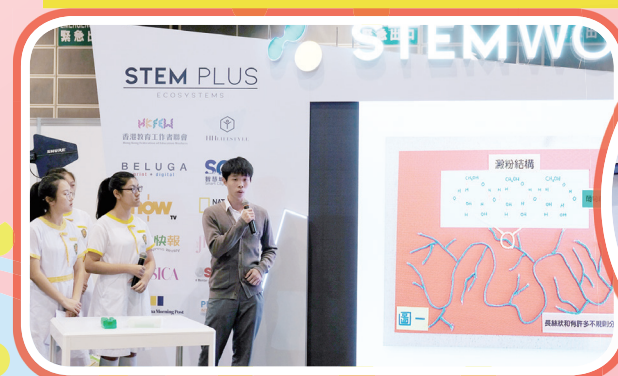
STEM WORLD@Book Fair 2019 參賽學生向公眾匯報

今學年第一期的可道校園報《道網》內容依舊豐富，除了各科及各社的不同比賽或活動報導外，也有學生會的聯歡活動及家教會就職的介紹。環境教育組獲綠色學校金獎，今期將以專題形式介紹該組推動環保的策略及成效，各位請勿錯過。農曆鼠年將至，祝各位同學、家長及老師身體健康、心想事成。