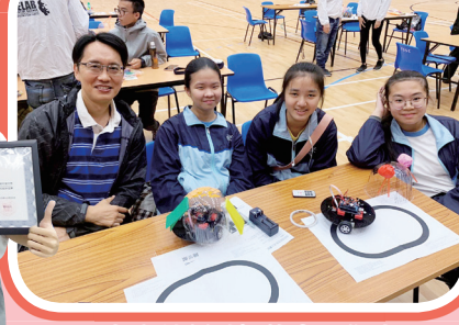
元朗程控循跡智能車工作坊