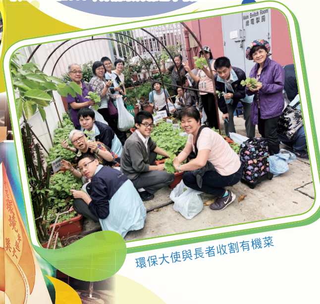
環保大使與長者收割有機菜