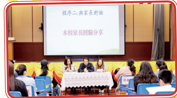
第十二屆家長教師會正副主席與家長交流心得

此外，是日中午家長教師會新舊委員均親臨本校家政室大展廚藝，為本校師生舉辦了「繽紛美食迎聖誕」大食會，一來感謝老師的悉心教導，家長們二來可在輕鬆愉快的環境下與老師交流，了解子女的學習及成長情況，場面溫馨。