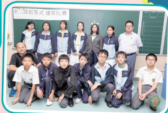
恆等式參賽者與工作人員大合照