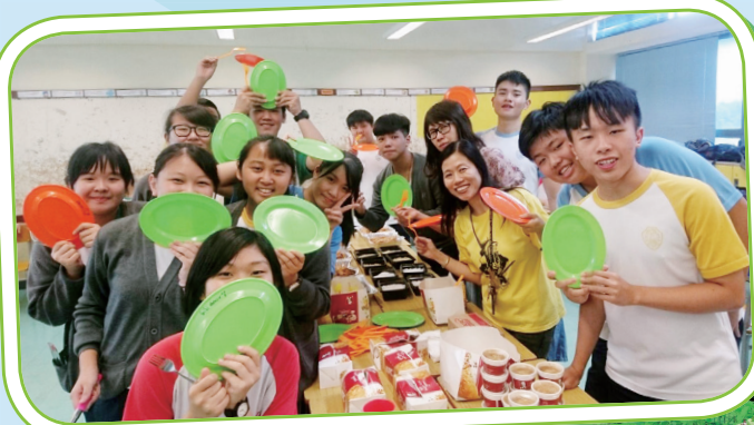
鼓勵師生於聯歡會使用循環再用的餐具