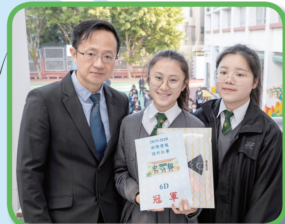
中六級壁報設計比賽冠軍班別