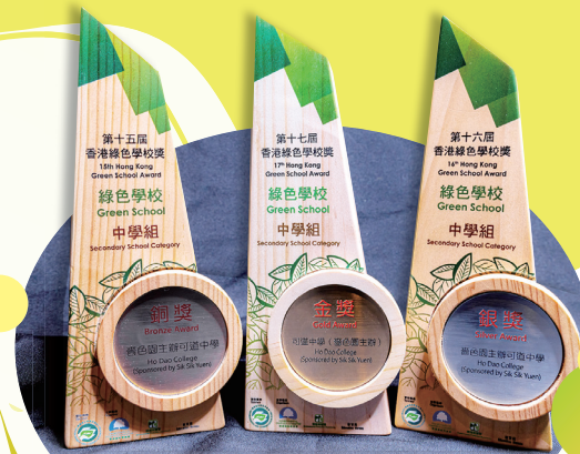
於2016至2019年分別取得綠色學校金銀銅獎

讓同學走出課室，親身接觸大自然，是培養同學環保觀念必不可少的。環境教育組除了安排環保大使接受基礎及專題環保章的培訓外，又安排同學參觀有機農莊、食物資源教育中心、中電綠適家居、T-park及屯門環保園。