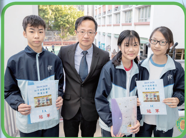
中一級課室佈置比賽有兩班同獲冠軍