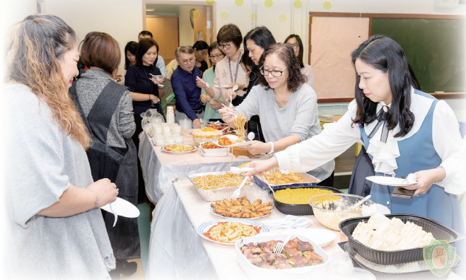
各人一起分享美食及交流子女的校園生活情況