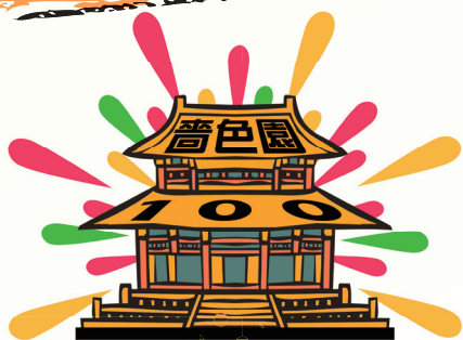
亞軍作品 5A 關升浩