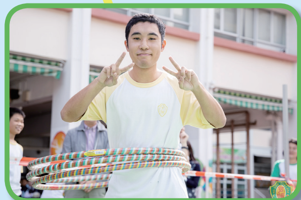
同時搖動三個呼拉圈