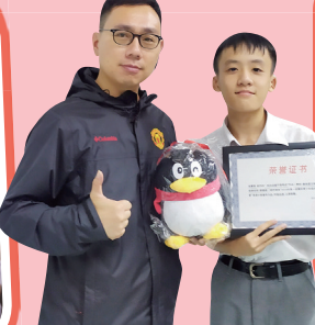
騰訊第一屆港澳青少年程式設計_港澳區優秀作品獎