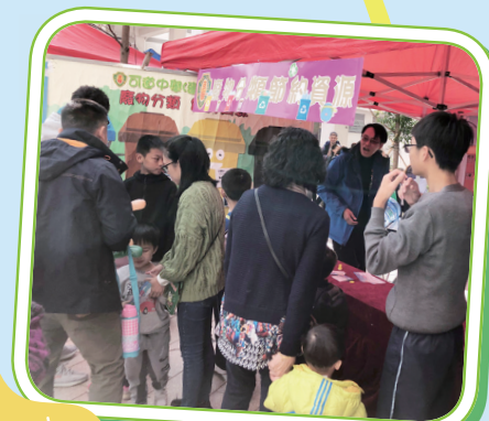
洪水橋嘉年華環保攤位