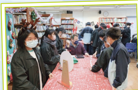
Students enjoy listening to Christmas carols while playing the lyrics game