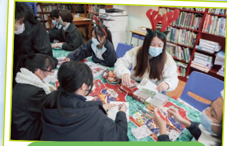
Students send Christmas wishes to their beloved