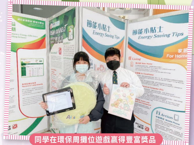
同學在環保周攤位遊戲贏得豐富獎品

德育及公民教育組透過課程、活動及師生日常接觸三方面推行品德情意及價值教育。課程方面，設立品德教育班主任課、薈色園中學聯校德育課程，加強德育及個人成長教育。多元化活動包括：教育局「愈感恩、愈寬恕、愈快樂計劃」、義工服務、環保講座及比賽等，過程中讓同學明白社會上有不少弱勢社群努力生活，從而學會尊重及接納他人。我們期望學生在完成六年的學習生活後，能常存感恩之心，感受他人善意與關懷，並能加以回報，建立積極、有意義的人生。