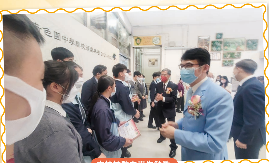
本校校監向學生勉勵