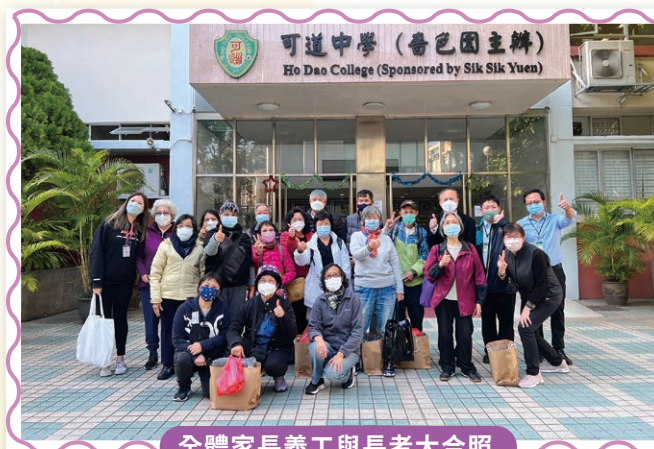
全體家長義工與長者大合照