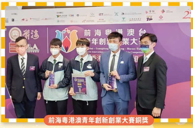
前海粵港澳青年創新創業大賽銅獎