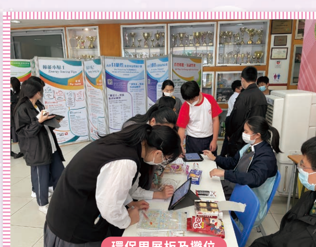
環保周展板及攤位