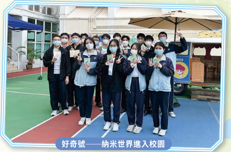
好奇號——納米世界進入校園

為了提高學生對科學的認識和興趣，以及提升學校學術氣氛，本校於12月19日至22日舉辦了理科周，活動包括：「科學書展」、「納米世界展覽」、「中一級科學比賽——紙飛機」、「中二級科學比賽——降落傘」、「中三級科學比賽——世界之最」及攤位遊戲。同學積極參與活動，投入比賽，寓學習於遊戲中，成效顯著。