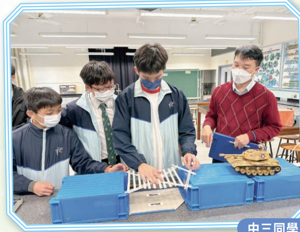
中三同學用飲管造橋