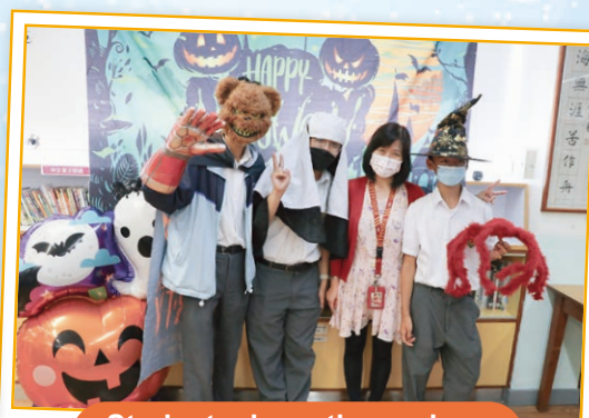
Students dress themselves up with halloween costumes