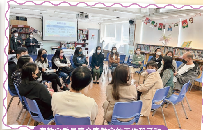
家教會委員簡介家教會的工作和活動