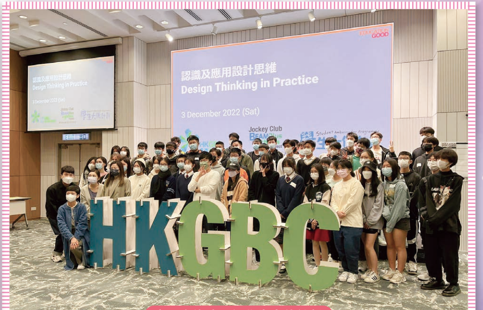
賽馬會綠建環評學生大使計劃