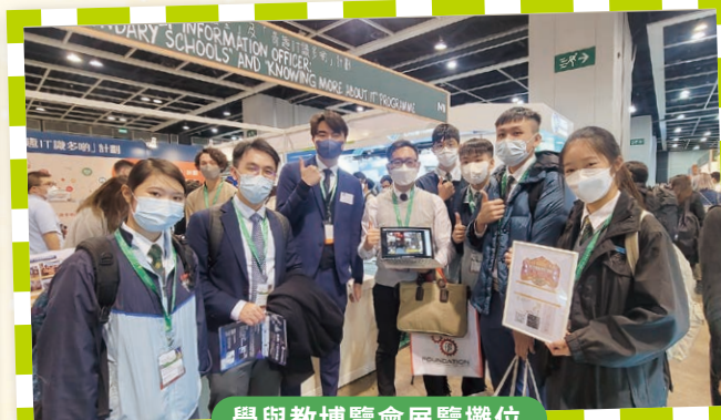
學與教博覽會展覽攤位