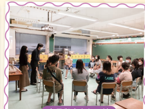
家長與班主任面談