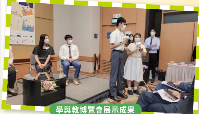
學與教博覽會展示成果