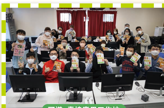
可道x青協應用工作坊