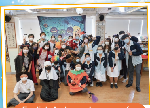
English Ambassadors pose for a group photo with teachers