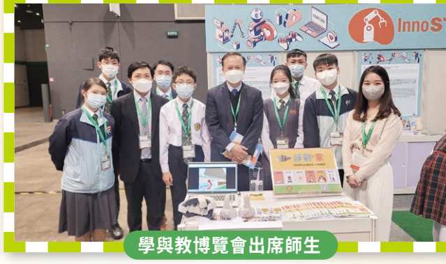
學與教博覽會出席師生