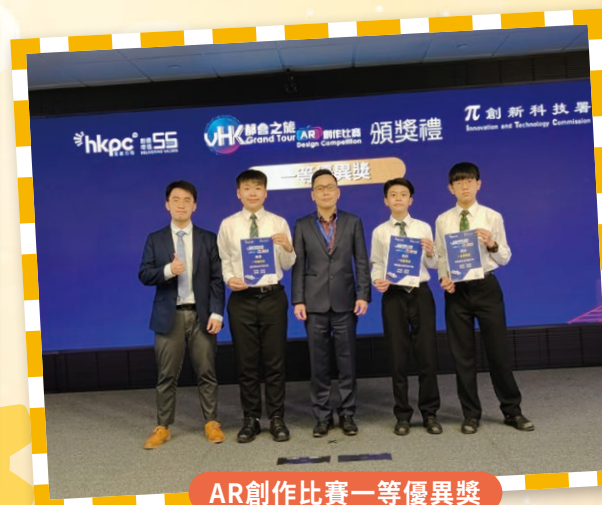
AR創作比賽一等優異獎