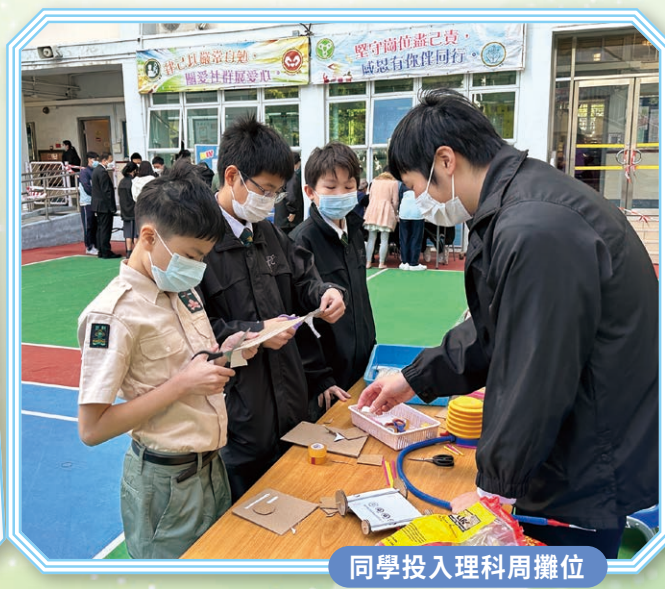
同學投入理科周攤位