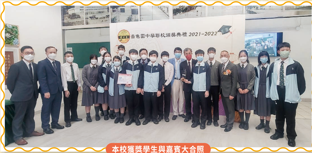
本校獲獎學生與嘉賓大合照