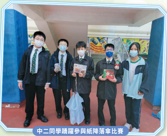
中二同學踴躍參與紙降落傘比賽