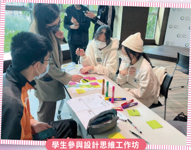
學生參與設計思維工作坊