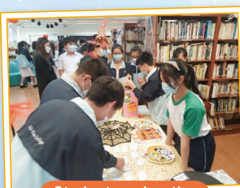
Students enjoy the halloween-based games