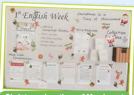
Christmas is a time of Merriment