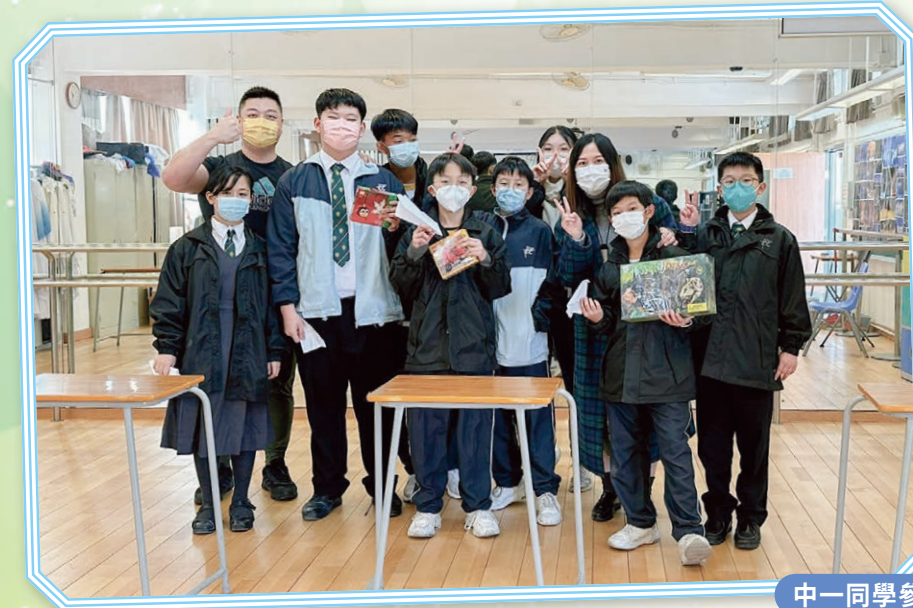
中一同學參加紙飛機比賽