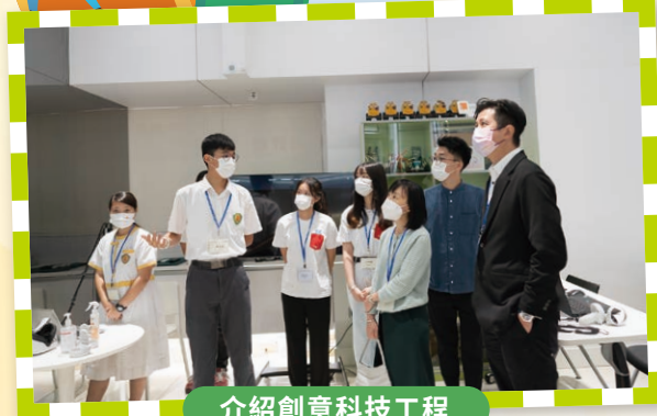
介紹創意科技工程

本校STEM義工團隊在第12屆「學與教博覽2022」記者招待會，展示得獎作品「元宇宙的靜觀家」，分享VR技術配合元宇宙設計，如何幫助使用者解決情緒問題。本校又與香港大學電子學習發展實驗室及AiTLE資訊科技教育領袖協會合辦「小學創科VR/AR設計獎」元朗區工作坊。工作坊有超過四十位參加者，課程由本校STEM義工團負責。同學從實踐中明白教學相長的道理，鞏固所學，獲益良多。