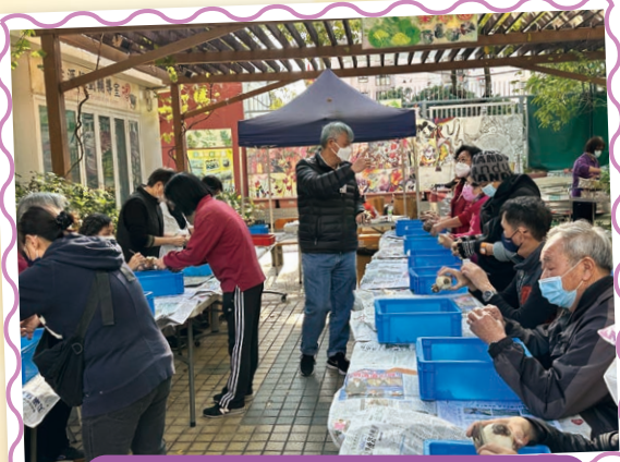
家長義工耐心講解切割水仙球的方法