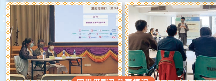
同學備戰及參賽情況